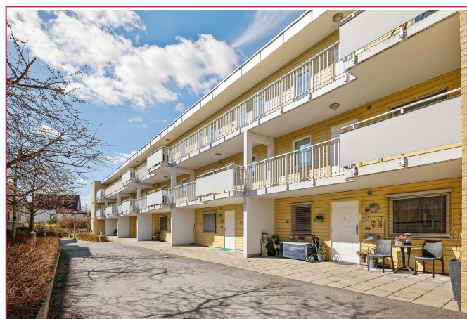
Velholdt fasade og hyggelig bakgård.