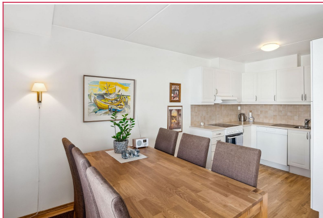
Åpen stue- og kjøkkenløsning som gir en sosial og luftig romfølelse.