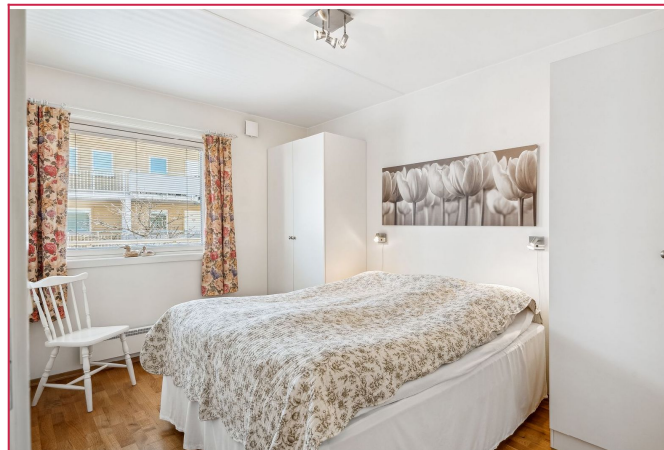
Romslig hovedsoverom med god plass til dobbeltseng og skap.