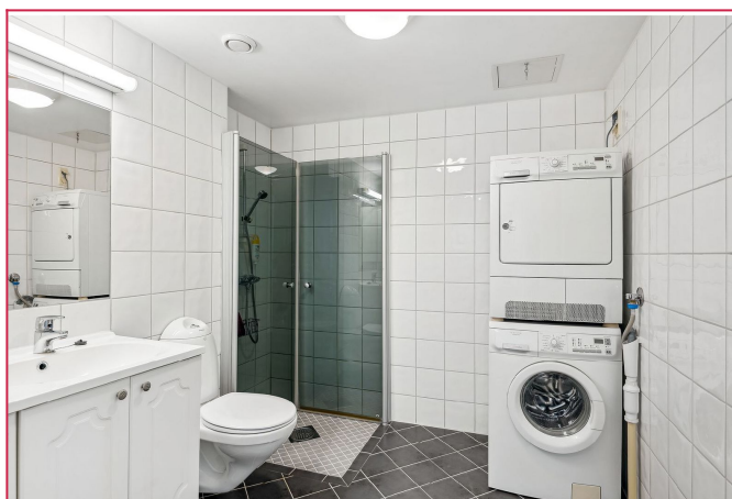
Baderommet leveres med hvitevarer inkludert i leien.