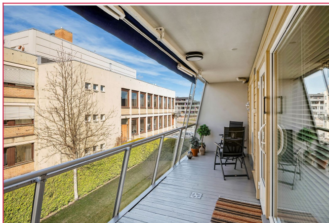
Balkong med rolig beliggenhet og gode solforhold om sommeren.