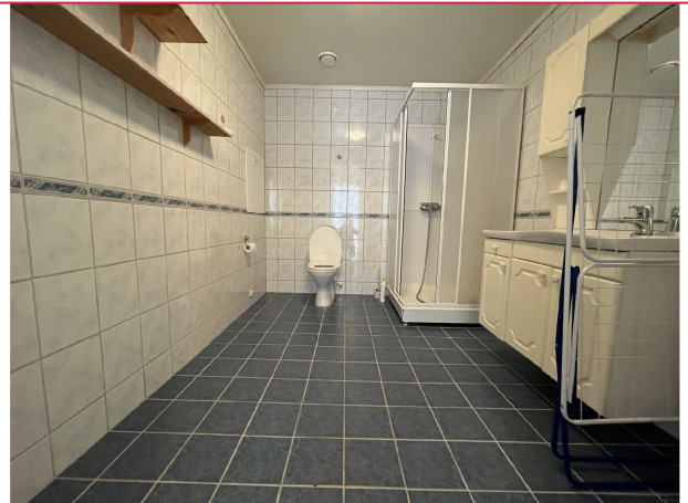
Stort, flislagt bad