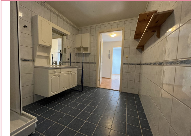
Opplegg for vaskemaskin på bad