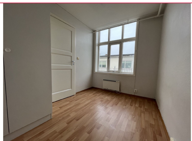
Soverom nr 2