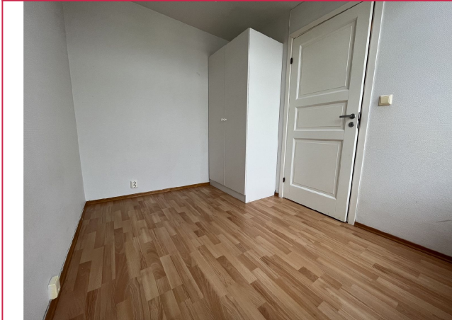
Garderobe på soverom nr 2