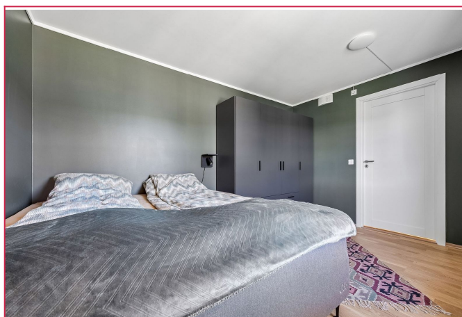
Hovedsoverom med garderobe.