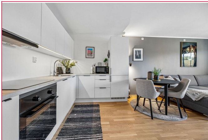
Kjøkken & Stue i åpen løsning