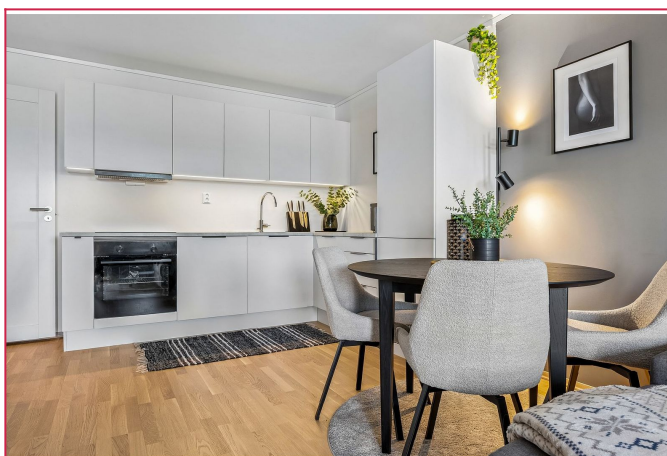
Plass til spisegruppe.