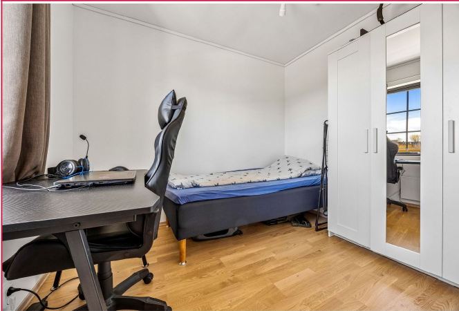
Soverom 2 har også garderobeskap.