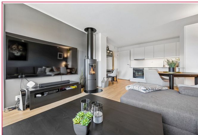
Stuen har mulighet til å fyre med ved.