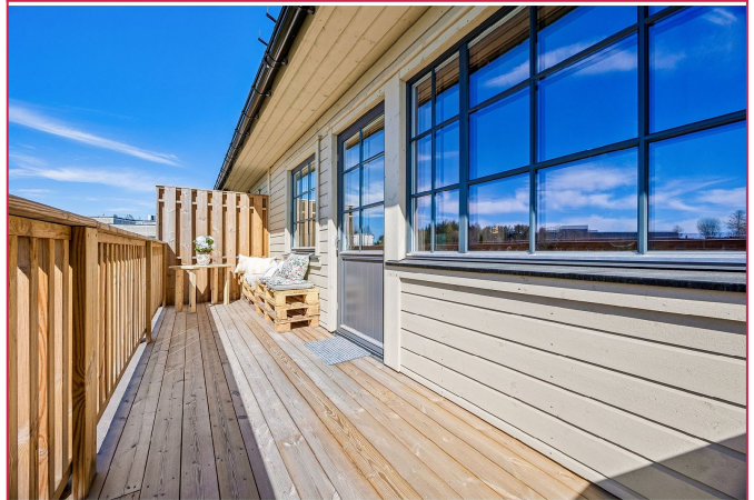
Balkong av god størrelse med sol fra formiddag til ut kvelden.