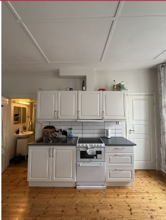
Åpen stue/kjøkkenløsning. Kombinert komfyr/oppvaskmaskin. Hvitevarer medfølger.