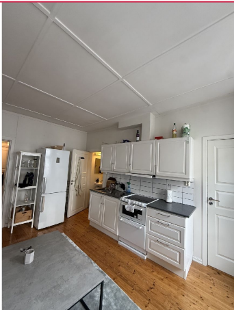
Kjøkken. Hvitevarer medfølger.