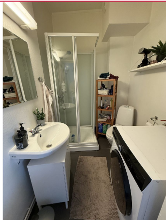
Bad med varmekabel. Vaskemaskin medfølger.