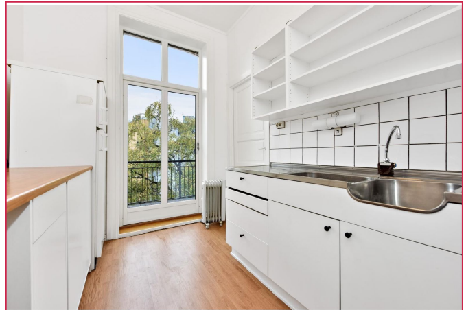
Kjøkken - eldre standard, men sjarmende. Utgang til balkong.