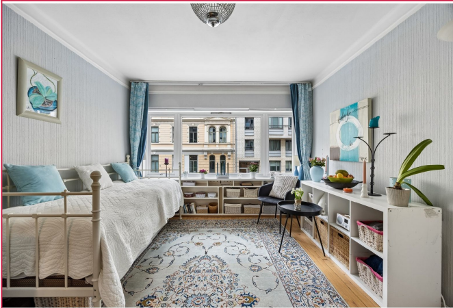
Velkommen til Huitfeldts gate 17!