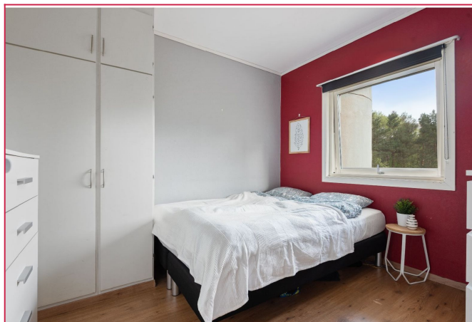
Leiligheten har to soverom.