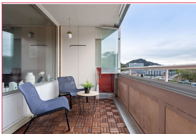
Hyggelig veranda med utsikt over nærområdet.