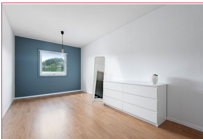
Dette soverommet er av svært god størrelse.