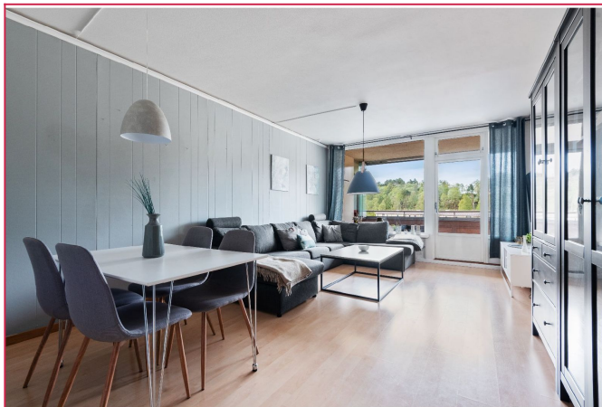
Flott leilighet beliggende i byggets 6. etg.