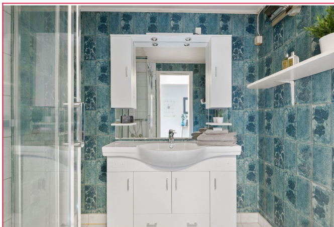
Baderom med dusj og servant. Eget toalett.