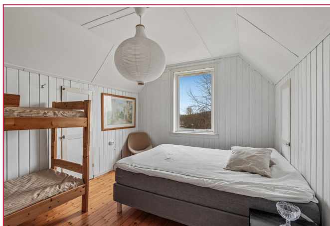
Romslig soverom i 2. etasje