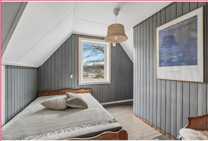
Soverom i 2.etasje