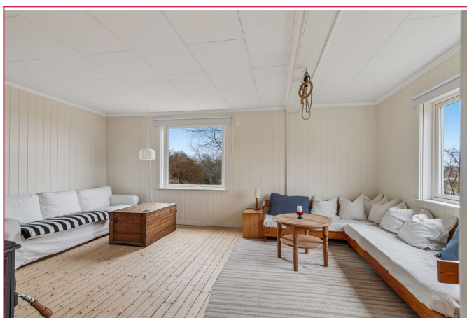
Stuen er romslig med fin utsikt ut til hagen!