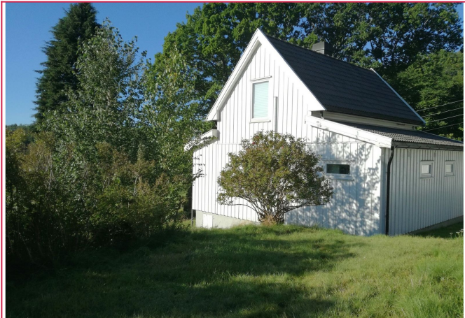
Utenfor boligen er det stor hage og fine uteområder!