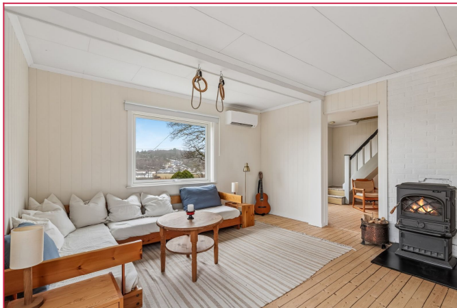
Gjennomgående lys og trivelig enebolig i et fint område!