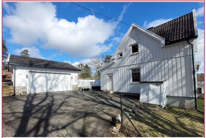
Dette er en meget hyggelig og sjarmerende enebolig i naturskjønne omgivelser