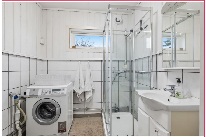
Bad med dusjkabinett, toalett, servant m/innredning og vaskemaskin