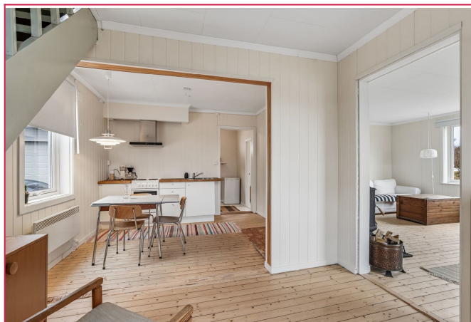
Boligen er gjennomgående lys og har en fin planløsning