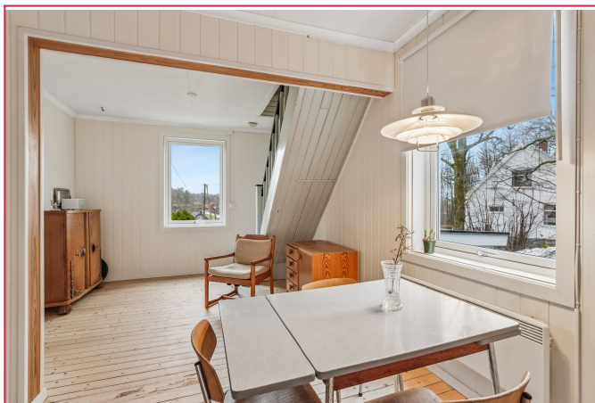
Lys og hyggelig spise plass