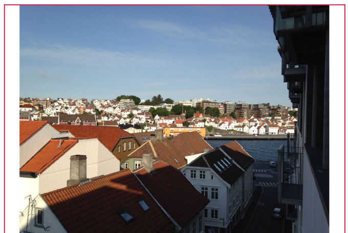
Utsikt fra balkong