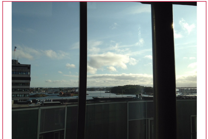
Utsikt fra soverom