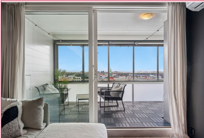
Det er tilkomst til balkong fra stue.