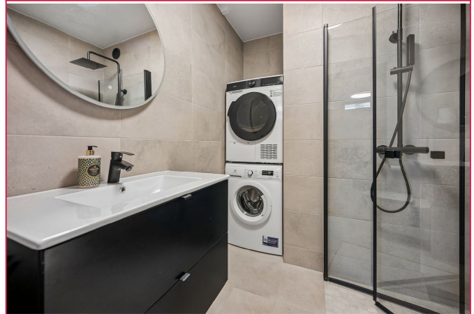
Baderom med hvitevarer.