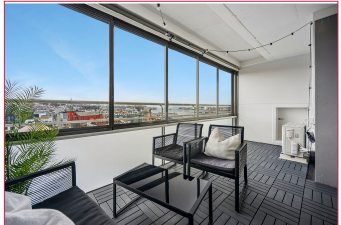
Balkong med flott utsikt.