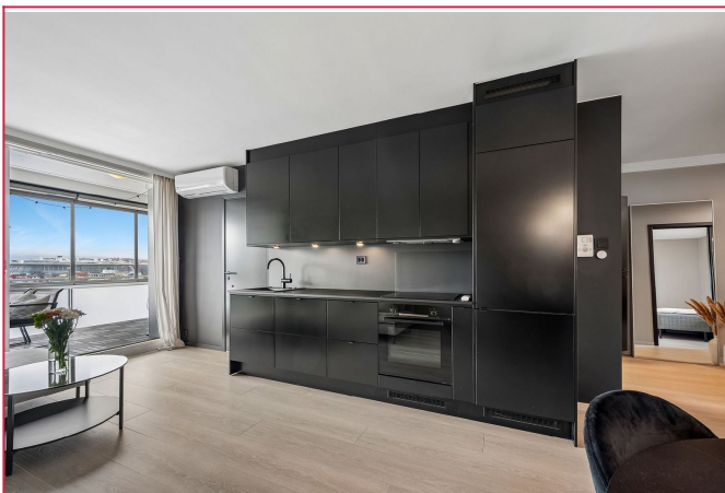
Kjøkkenen med integrerte hvitevarer.