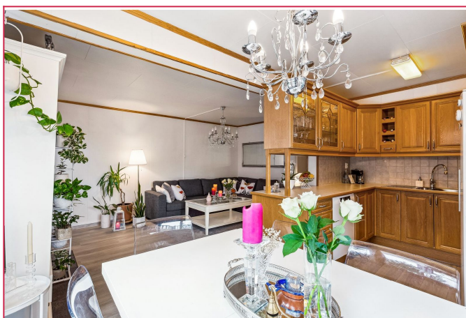
Åpen stue- og kjøkkenløsning