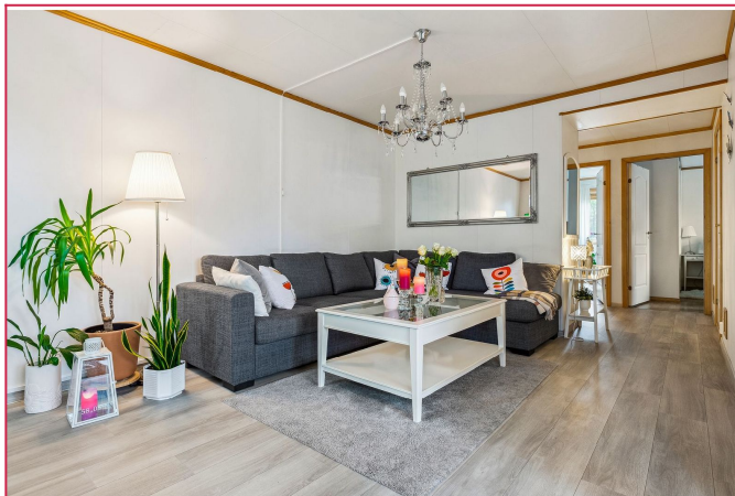
Velkommen til Arnt Forseths veg 62