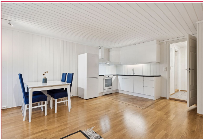
Kjøkken - nyere innredning med integrert oppvaskmaskin, komfyr og kombiskap