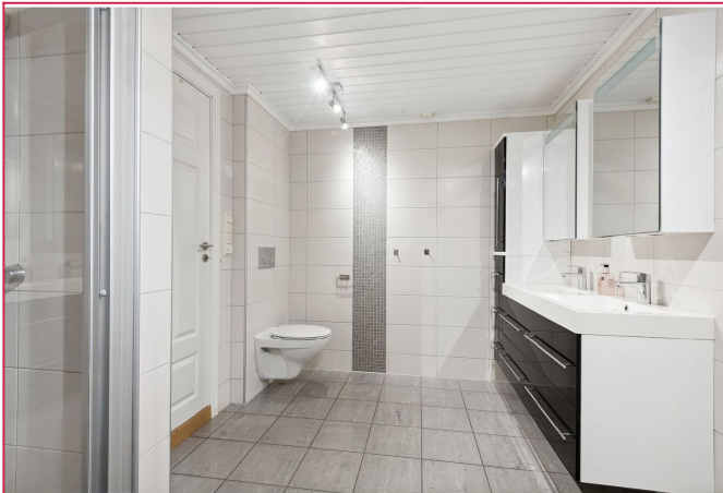
Romslig flislagt bad