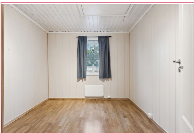
Soverom - med garderobeskap og lagringsmuligheter på loft.