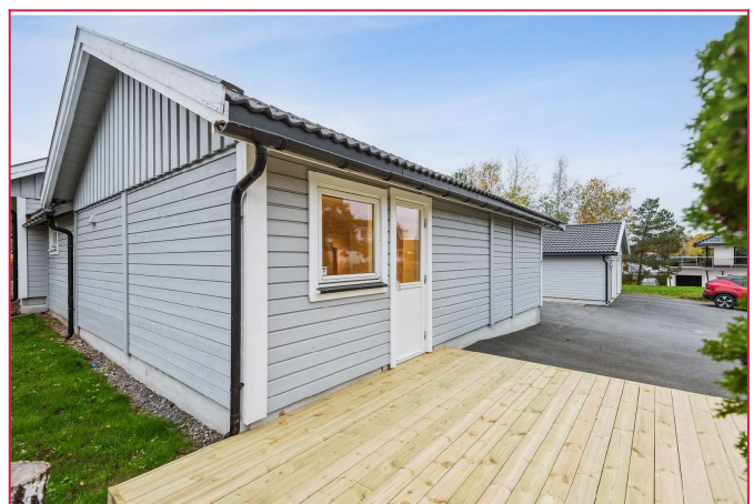
Uteplass - Egen platting, parkering og en liten hage