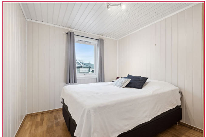
Hovedsoverom - med plass til dobbeltseng og garderobeskap