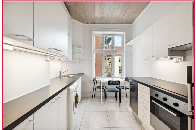
Felles kjøkken av god størrelse med plass til spisebord for 3 personer.