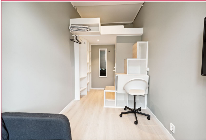
Soverom 2: LEDIG