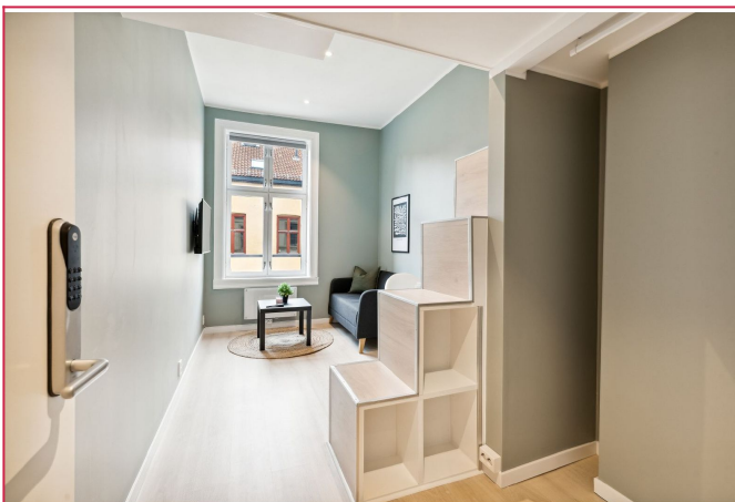
Alle rom er utstyrt med sitte gruppe, TV på vegg, smarte løsninger for oppbevaring og kodelås på dør