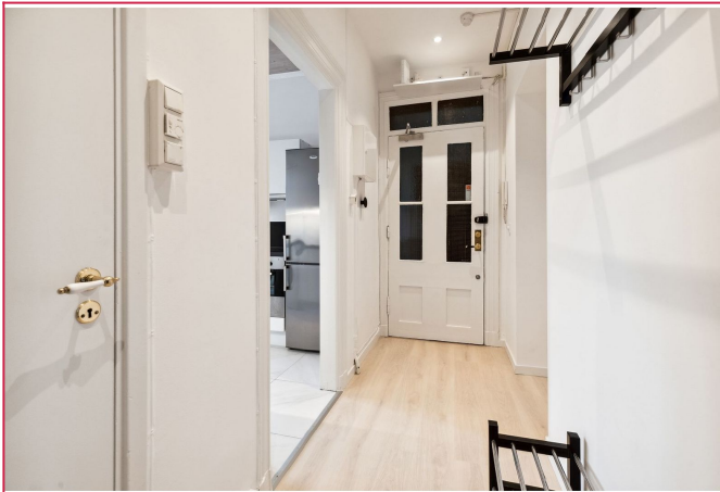
Entre med god plass til oppheng av yttertøy