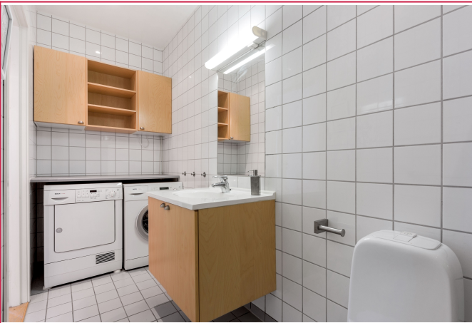
Pent flislagt bad med varmekabler