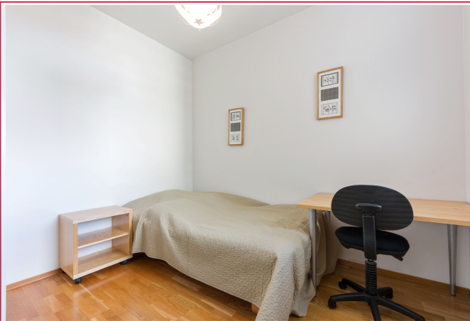
Soverom 2 - God plass til dobbeltseng