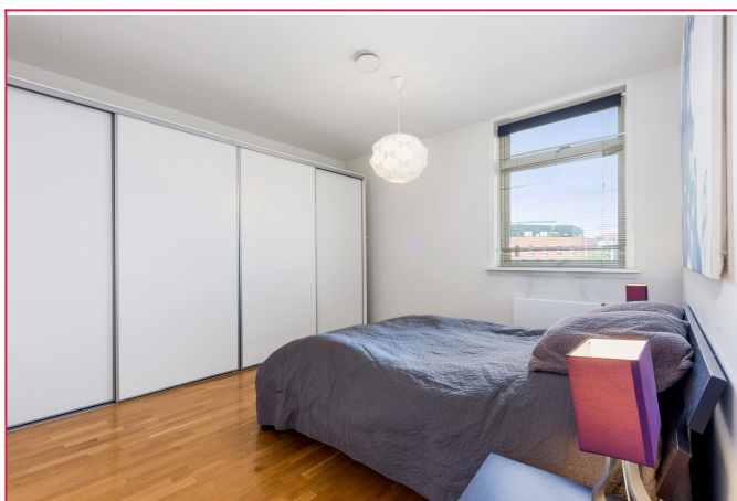
Hovedsoverommet er lyst og romslig. Stor skyedørsgarderobe