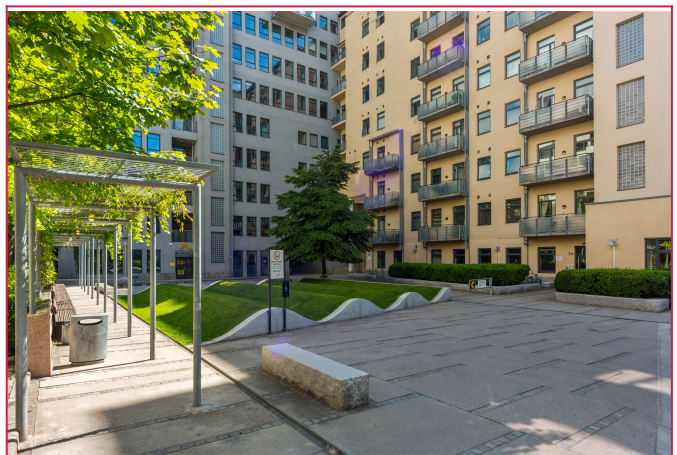
Velkommen til Pilestredet park 34!