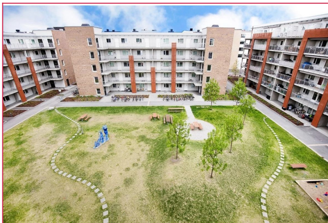
Fra balkongen er det utsikt over bakgården.