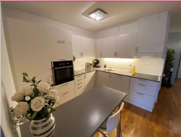
Kjøkkenet har integrerte hvitevarer.