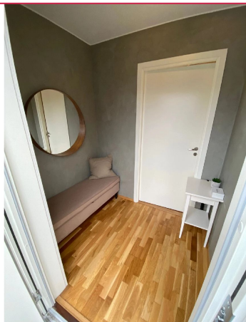
Entré med plass til klær og sko.