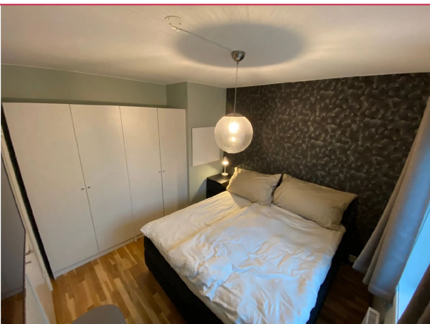
Romslig soverom med plass til dobbeltseng. Garderobe medfølger.