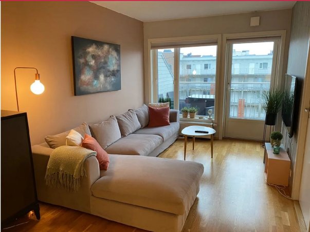
God plass til både sofa- og spisegruppe.