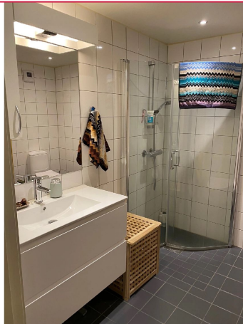
Bad med opplegg til vaskemaskin.