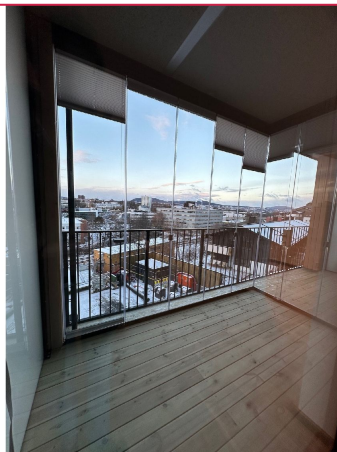
Solrik innglassert balkong med utsikt