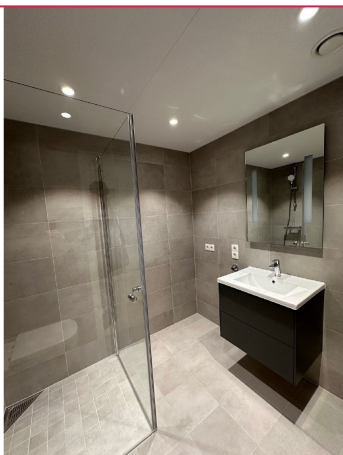
Lekker flislagt bad med opplegg for vaskemaskin