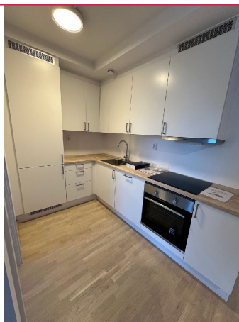
Kjøkken med hvitevarer