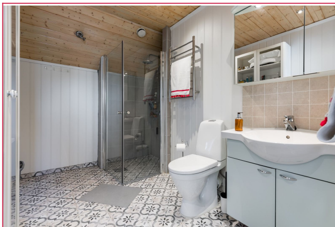
Hovedbad i 2. etasje