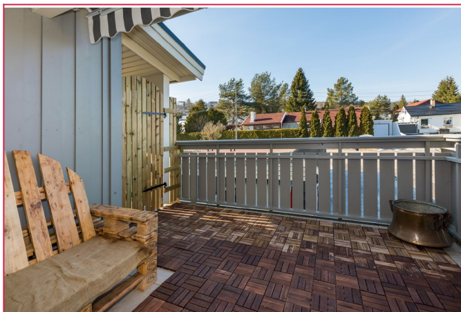
Skjermet balkong v/inggangsparti.