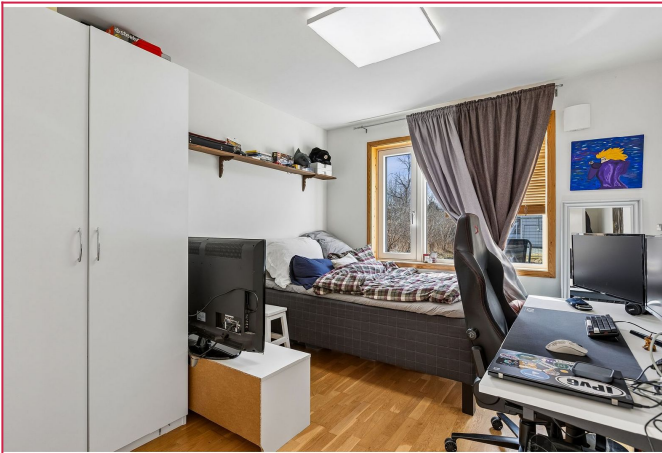
Boligen blir leid ut møblert