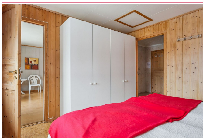
Hovedsoverommet er romslig med stor garderobe og direkte adkomst til badet.