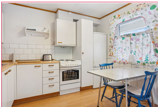
Kjøkkenet har frittstående hvitevarer som komfyr, kombiskap og oppvaskmaskin.