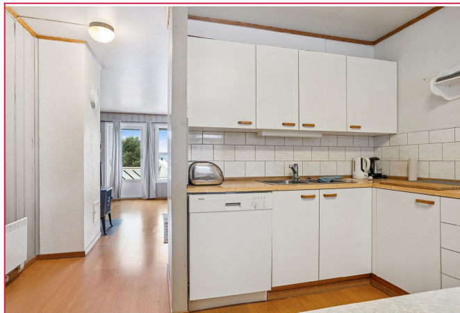
Delvis adskilt fra stuen med en liten delevegg.