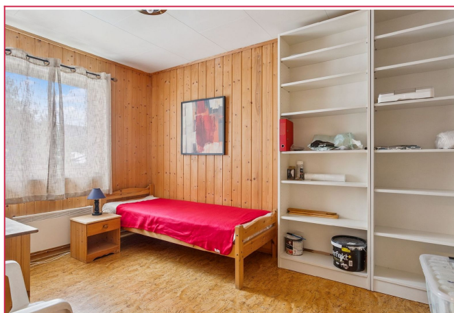
Soverom 2 er også god i størrelse med kommode, hyller og seng. Perfekt som hobby- eller gjesterom.