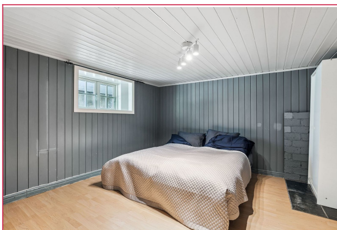
Pent hovedsoverom med dobbeltseng og garderobeskap. Tilknytning til liten bod.