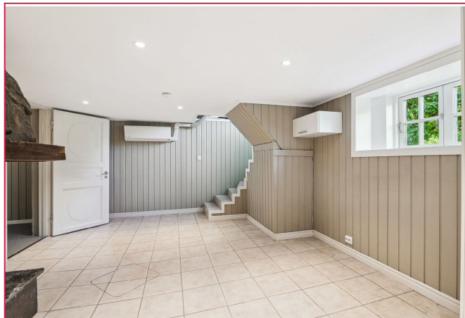
Separat inngangsdør på siden av boligen.