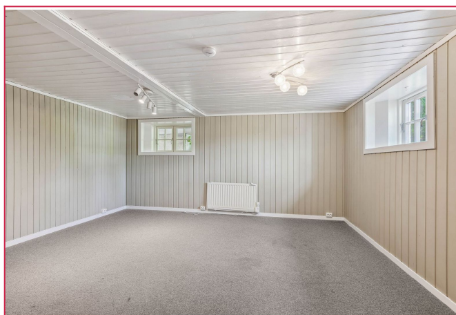
Soverom 2 er lyst og trivelig. God plass til dobbeltseng.