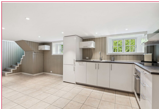
Leiligheten har både varmepumpe og peis.