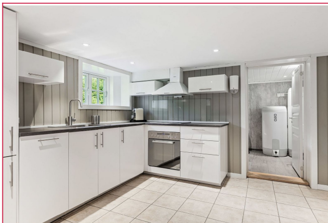
Lyst og moderne kjøkken.