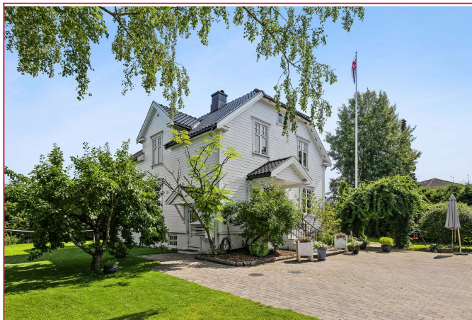
Trivelig leilighet på Teie på Nøtterøy.