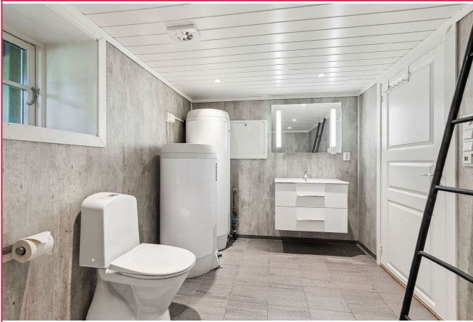
Delikat flislagt baderom.