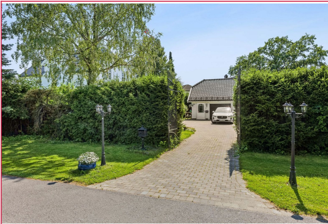
Velkommen til visning!