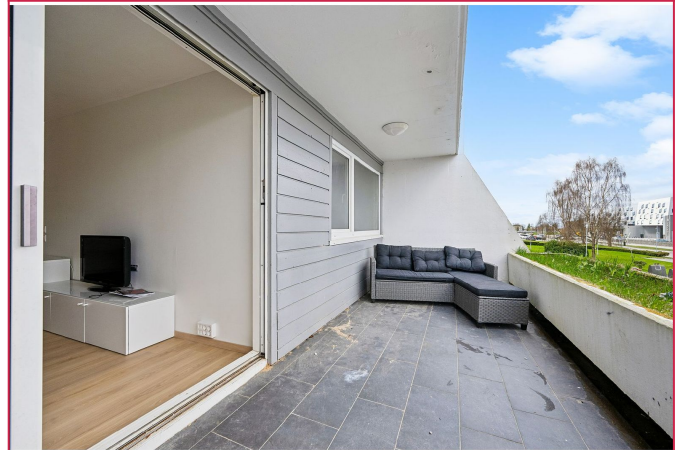
Balkong med plass til utemøbler