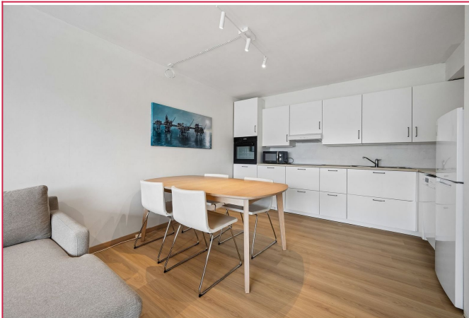
Med god plass til spisebord og stoler