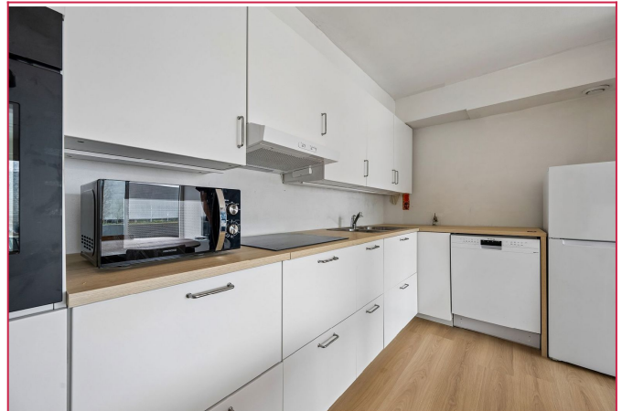
Rikelig med benkeplass og oppbevaring