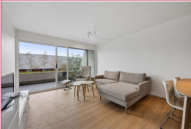
Lys og åpen stue med utgang til balkong