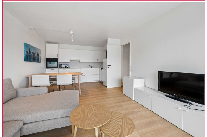
Åpen løsning mellom stue og kjøkken