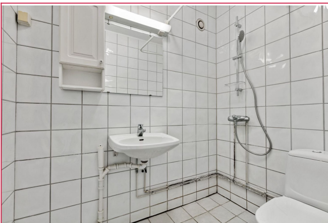
Bad. Bilde tatt av lignende bolig. Avvik kan forekomme.