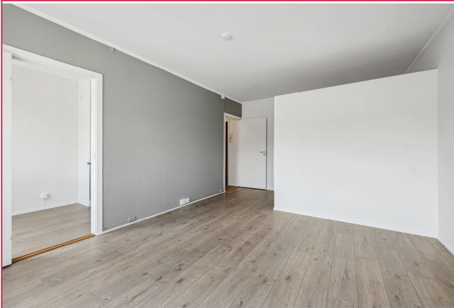
Her er det god plass til å sette opp sofa og har en sovealkove .Bildet tatt av lignende bolig.