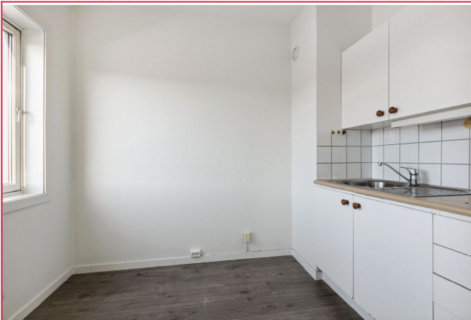
Kjøkken er plassert i et eget rom. Hvitevarer følger ikke med.