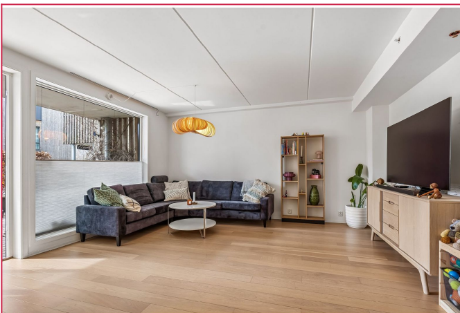
God plass til møblering i stuen