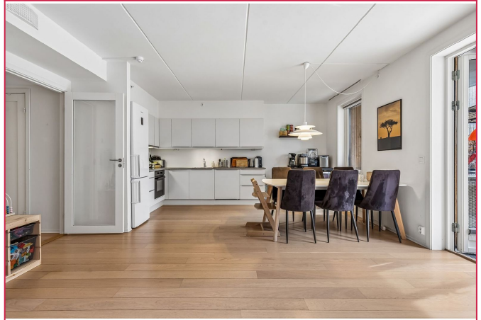
Åpen kjøkken stue løsning med plass til spisebord