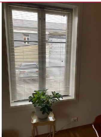
Stuen har store vinduer som slipper inn godt med lys