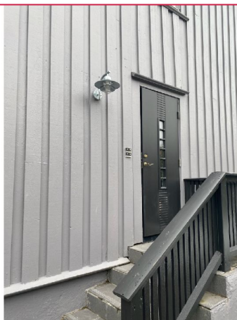
Felles inngangsparti som deles av fire leiligheter