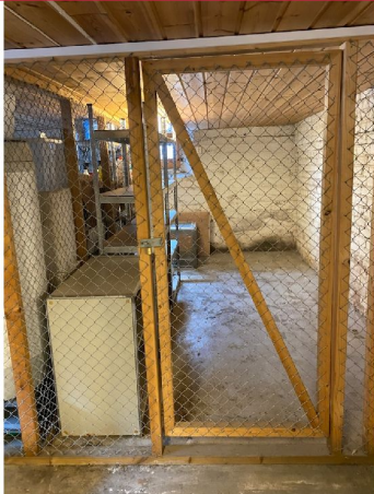
Boden byr på rikelig med lagringsplass