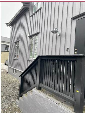
Sameiet har de senere årene gjennomført mye utvendig vedlikehold