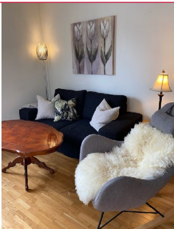
Lys og romslig stue