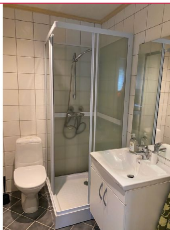
Bad/WC med dusjkabinett, elektriske varmekabler og opplegg for vaskemaskin