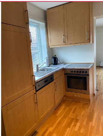
Kjøkken med integrerte hvitevarer

SAKSNUMMER 66146 - NEDRE KIØSTERUDSGATE 6 B, 3023 DRAMMEN