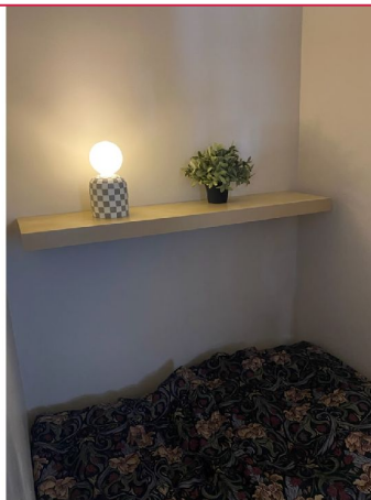
Sengen passer akkurat i sovealkoven og medfølger