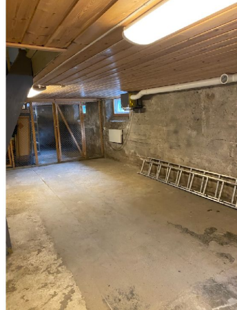
Det medfølger en bod i kjelleren