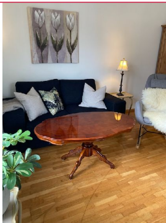
Stuen har god plass til sovesofa og stuebord