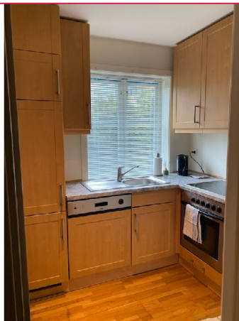
Kombiskap (kjøl/frys), oppvaskmaskin, komfyr og platetopp medfølger