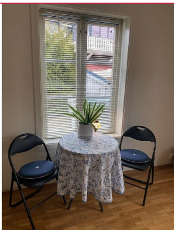
På motsatt side av stuen er det plass til spisebord