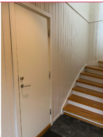
Felles inngangsparti som deles av fire leiligheter