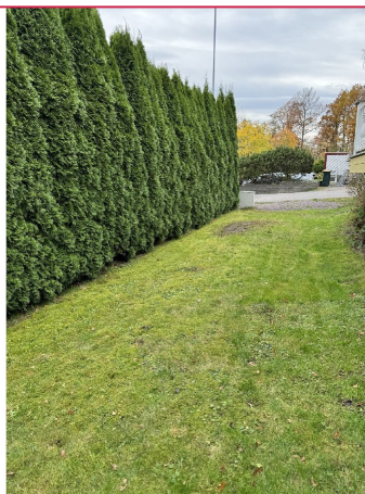
Koselig hageflekk. 1 p-plass i oppkjørsel. Velkommen til visning!