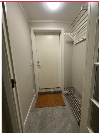
Entré med gulvvarme.