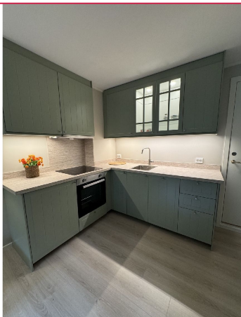
Lekker, nyoppusset leilighet på Husvik.