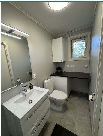
Delikat baderom med WC, servant m/innredning, dusj og vaskemaskin. Gulvvarme.