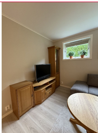
Pen stue med sofagruppe og TV.