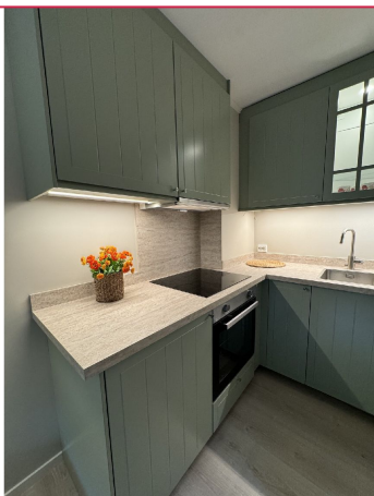
Flott kjøkken med integrert oppvaskmaskin, kjøleskap m/frys, komfyr og steketopp.