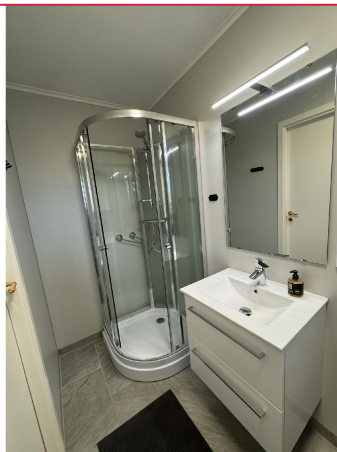
Delikat baderom med WC, servant m/innredning, dusj og vaskemaskin. Gulvvarme.