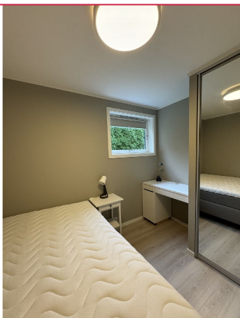
Nydelig soverom med dobbeltseng, skrivepult og integrert skyvedsørsgarderobe.