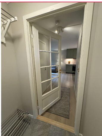
Entré med gulvvarme.