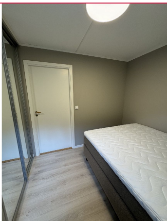
Nydelig soverom med dobbeltseng, skrivepult og integrert skyvedsørsgarderobe.