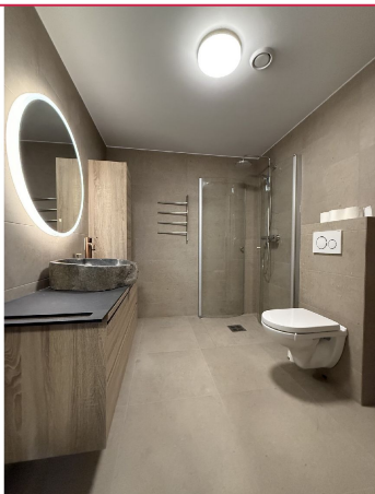
Lekker bad med hjørnedusj, toalett, skap og servant m/innredning. Opplegg for vaskemaskin