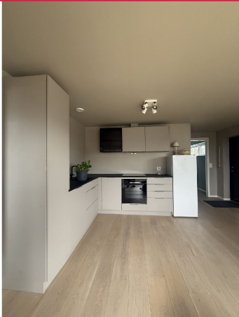
Helt ny 3-roms leilighet fra 2025/2026!