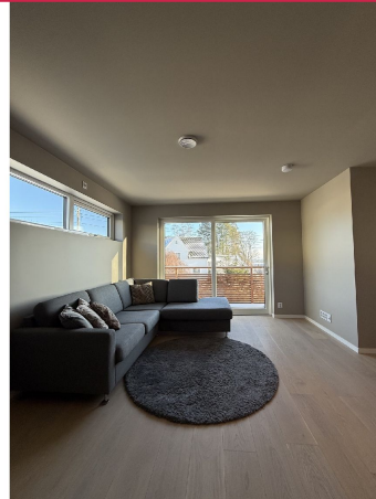
Stue med direkte utgang til terrasse