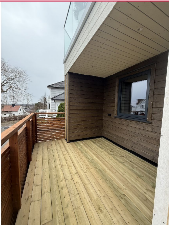
Terrasse med god plass til utemøbler