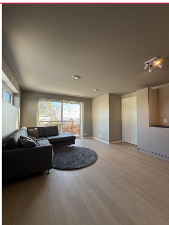
Velkommen til visning!