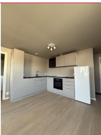
Lekker kjøkken med alt av hvitevarer