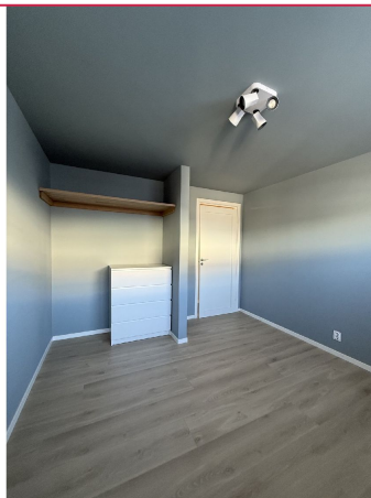
Hovedsoverom, samt videre disponibelt rom