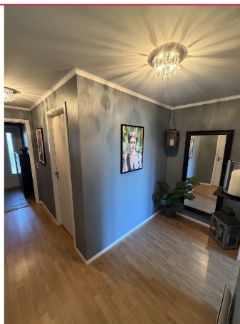
To boder for plass til oppbevaring