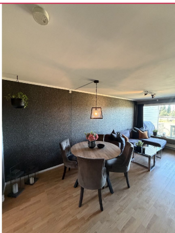
Stue med god plass til sammenkomster.