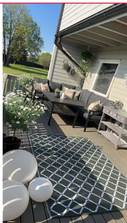
Sittegrupper utendørs med bra solforhold