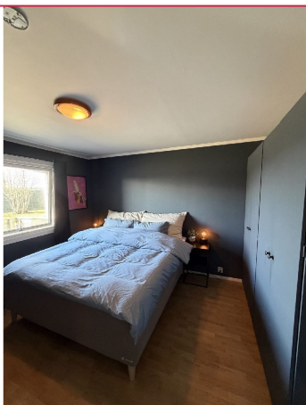
Stort soverom med god garberode plass