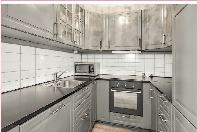
Kjøkkenen med integrerte hvitevarer