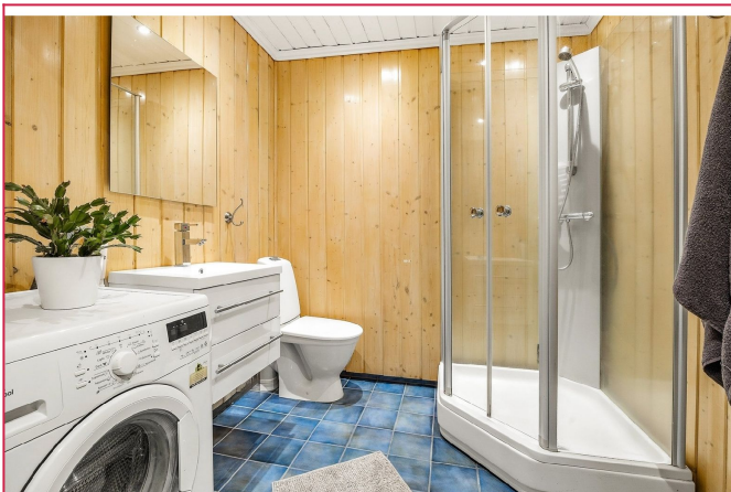
Bad/WC med gulvarme, dusjkabinett og vaskemaskin