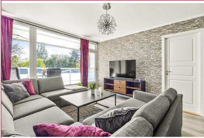
Stue med utgang til innglasset balkong