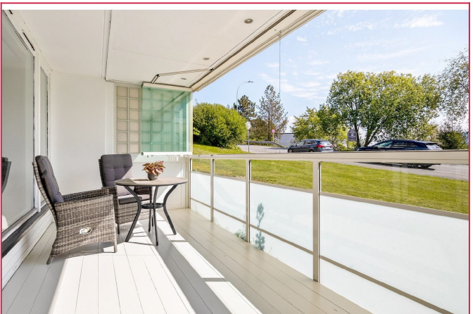
Romslig innglasset balkong på ca. 15 m 2