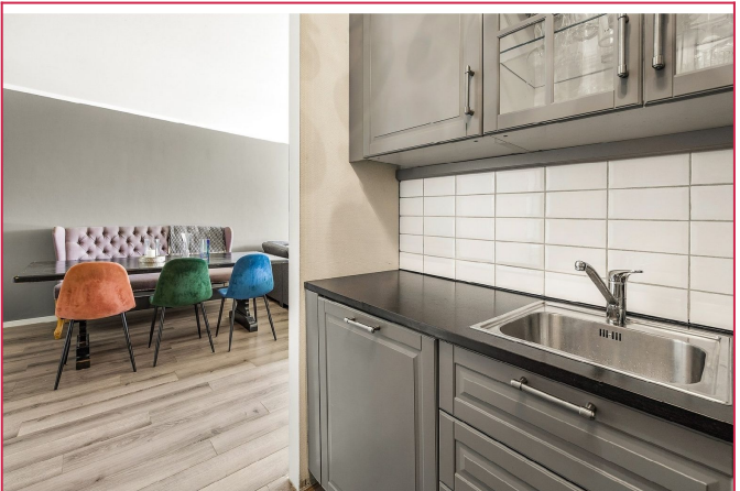
Stuen gir også rom til spisegruppe i tilknytning til kjøkkenet