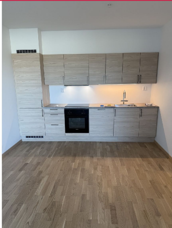
Pent kjøkken med integrerte hvitevarer og godt med skapplass.