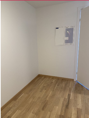
Romslig gang med god plass til oppbevaring og skoskap.