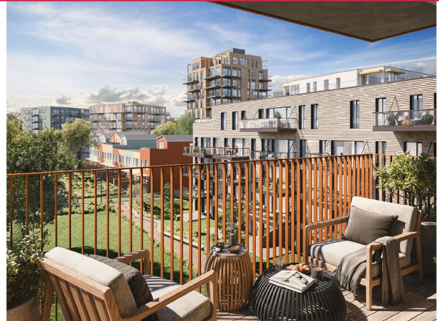
Solrik vestvendt balkong. Bildet er illustrasjonsbilde fra 4. etasje