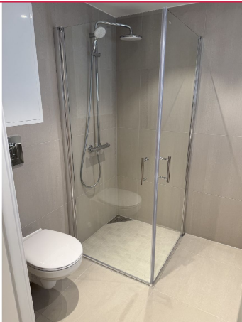
Pent flislagt bad med innfellbare dusjvegger og wc. Varme i gulv.