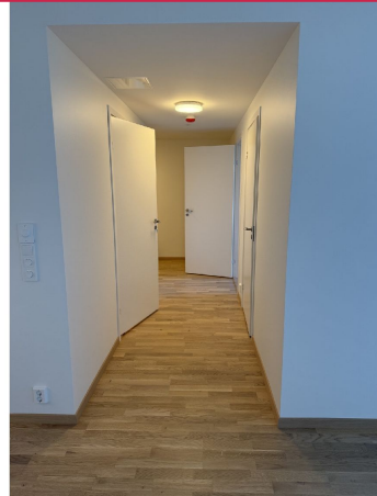
Mellomgang mellom bad og soverom mot entrè.