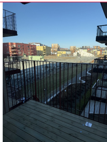
Fin balkong med utsikt mot naboblokk og internveier. Bildet er tatt tidlig morgen.