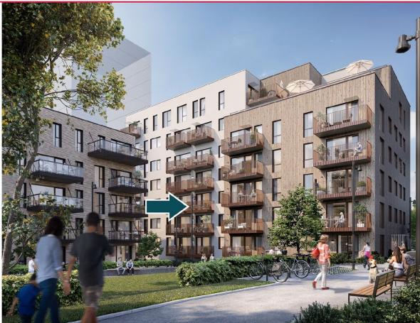
Leiligheten ligger i 3. etasje ut mot grøntområder og internveier