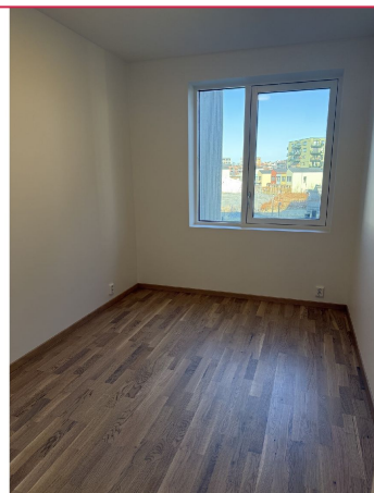
Leiligheten har to soverom som ligger vegg i vegg.