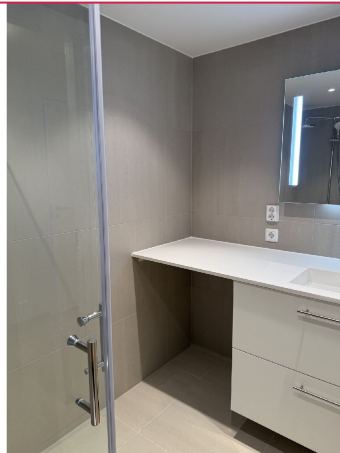
Badet har pene fargevalg, og vaskemaskin vil bli installert.