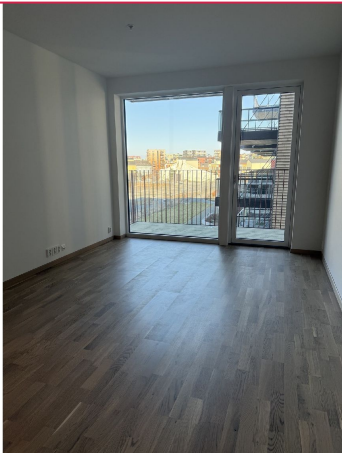
Åpen løsning mellom stue og kjøkken. Utgang til balkong.