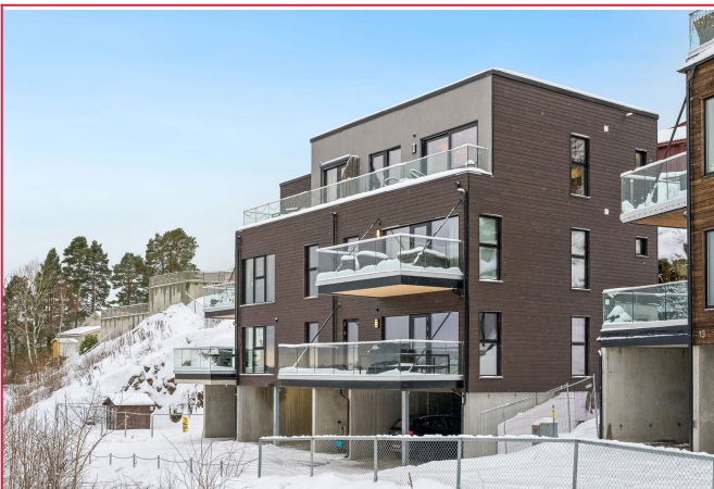
Velkommen til Bjørnstadveien 11