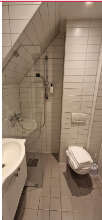
Pent flislagt bad med varmekabler.