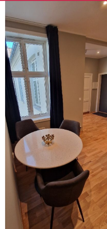
Plass til spisebord ved kjøkkenet.