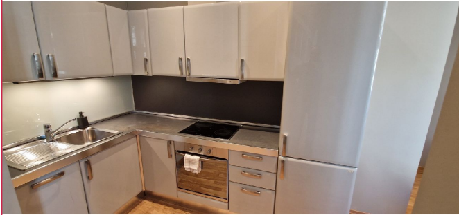
Flott kjøkken med god skap og benkeplass.