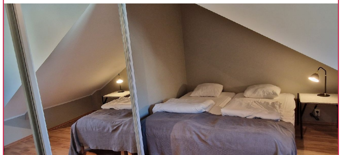
God plass til dobbeltseng i 2.etasjen.