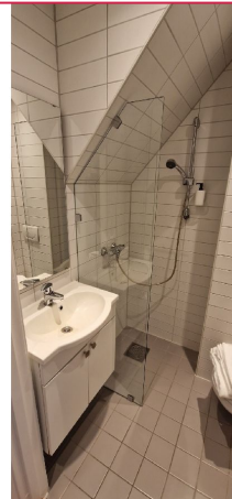
Opplegg til vaskemaskin på bad.