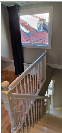
Trapp opp til soverom.