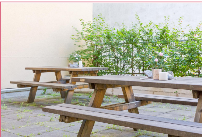
Hyggelig bakgård med sittegrupper