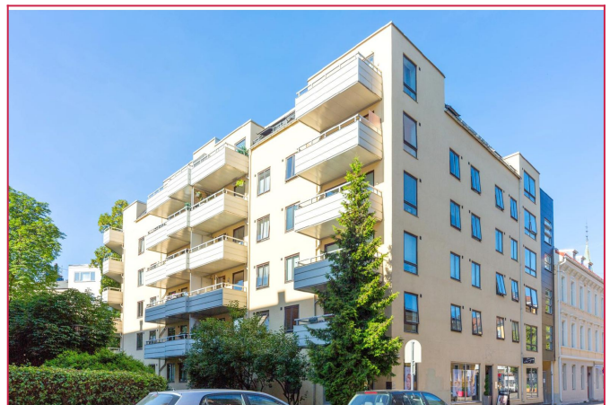
Velkommen til Wilhelms gate 1!