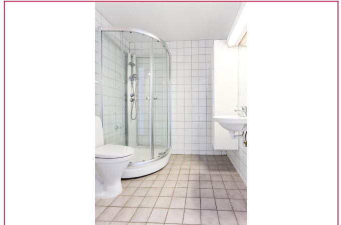
Pent flislagt bad. Opplegg for vaskemaskin.