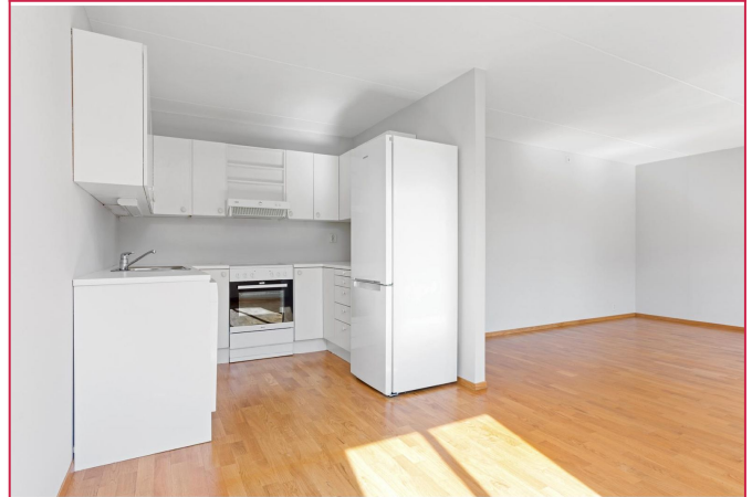
Delvis åpen kjøkkenløsning. Hvitvarer medfølger