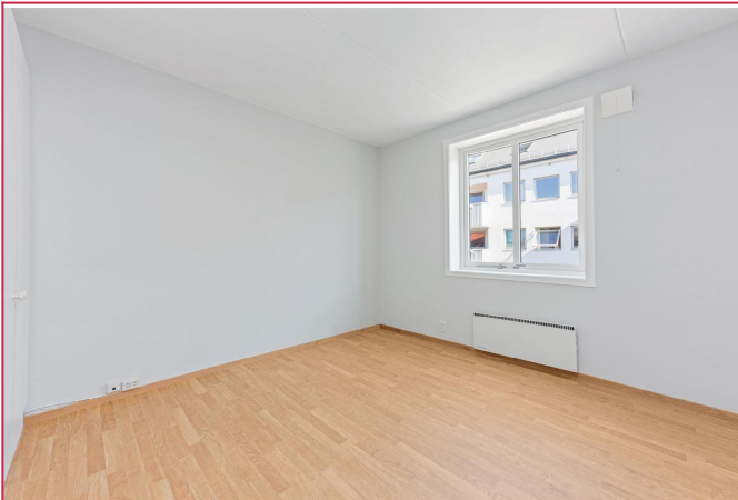
Hovedsoverommet fremstår som lyst og romslig. Garderobeskap medfølger