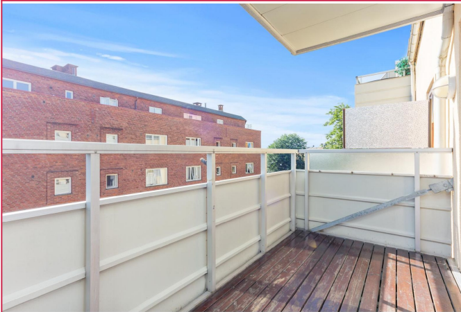
Hyggelig balkong med plass til utemøblement