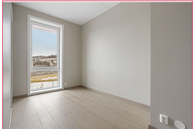
Hele leiligheten har solskjerming som styres med fjernkontroll.