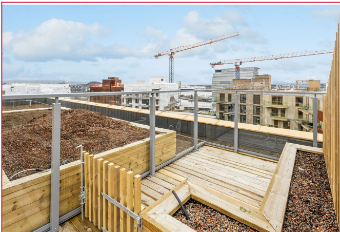
Leiligheten er en av få i oppgangen som har en privat parcell på takterrasse!