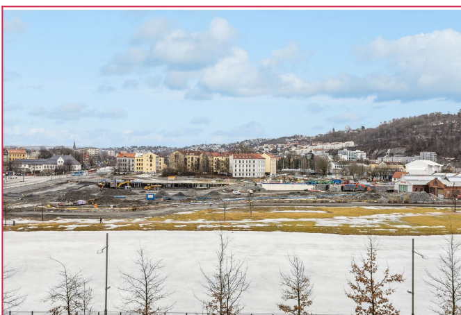
Utsikt fra balkongen mot Middelalderparken. Byggearbeidene er nå i all hovedsak ferdigstilt.