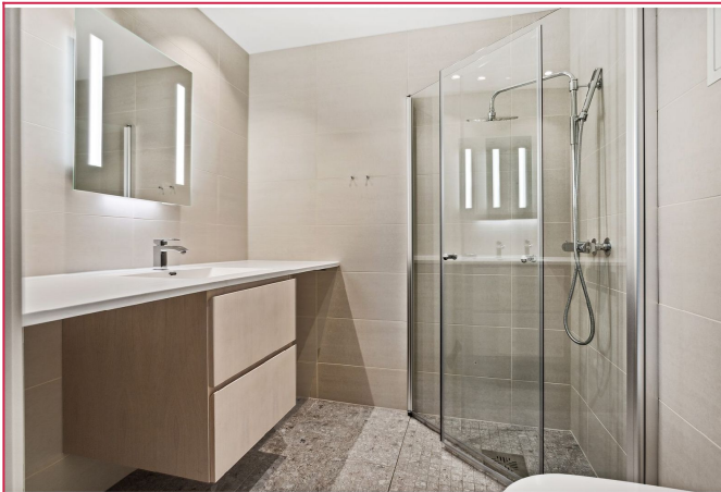
Pent bad med downlights i tak.