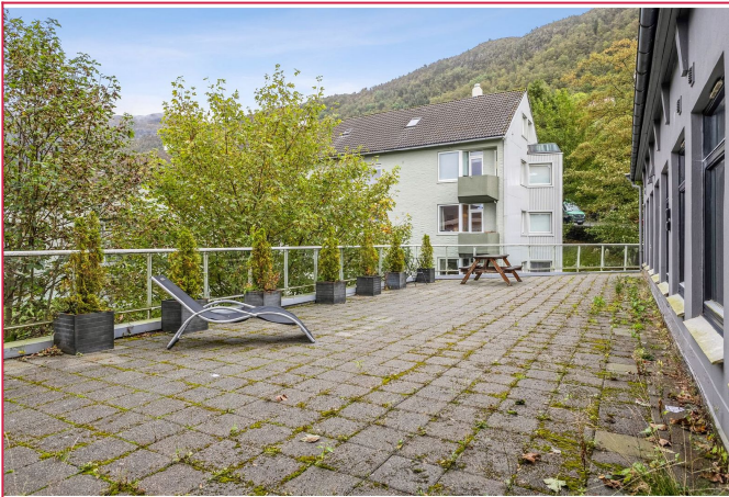
Felles takterasse for beboerne i Landåslien 2.