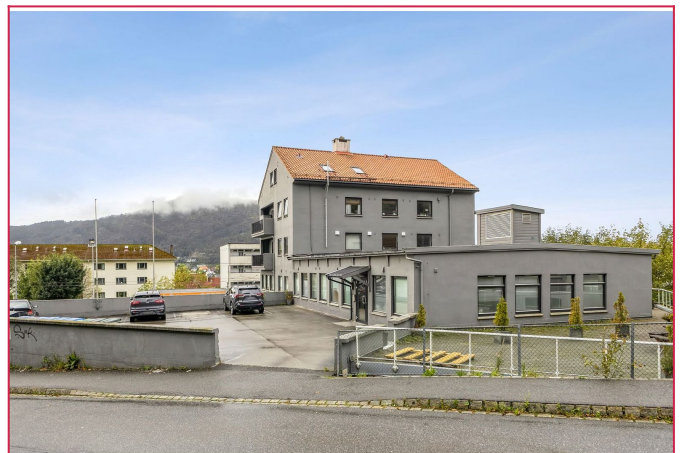
Velkommen til Landåslien 2! gjesteparkering på fremsiden, Rema 1000 i 1. etasje og felles terrasse.