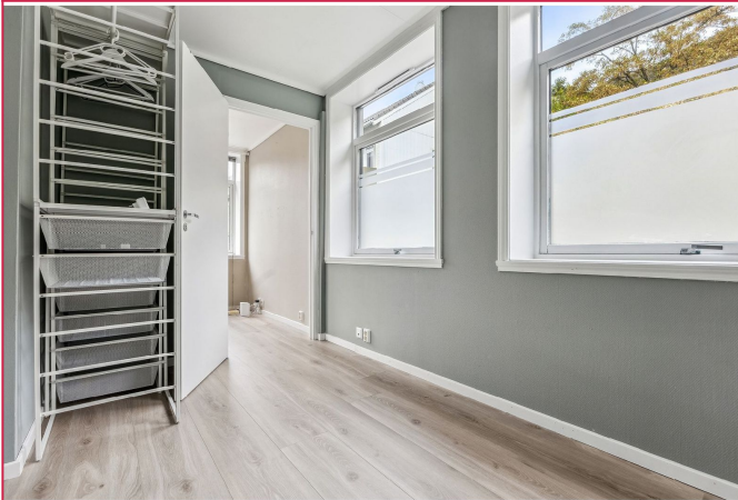
Soverommet har gått med lysinnslipp, men også skjerming fra forbipasserende.