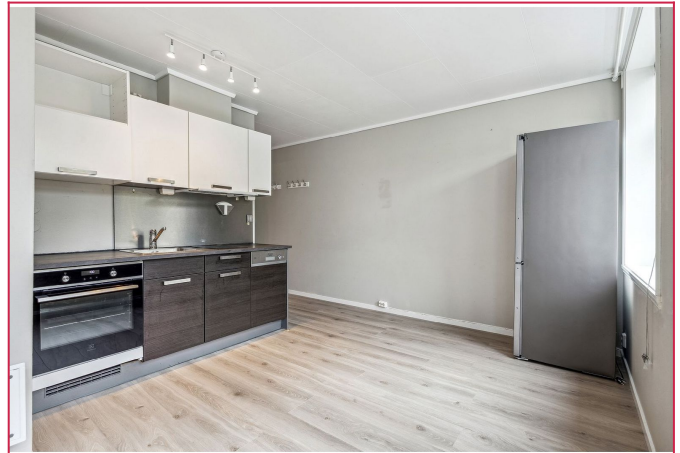
Kjøkken og stue i ett - alle hvitevarer medfølger.