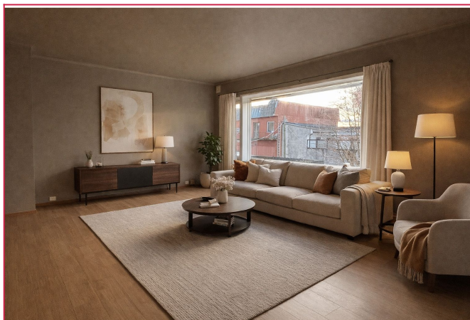
Eksempel på møblering (Bildet er stilet ved bruk av kunstig intelligens, avvik kan forekomme)