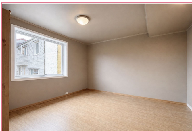
Leiligheten har et stort og nymalt soverom. God plass til dobbelt seng og øvrig møblement.