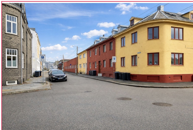
Velkommen til Breidablikgata 104. Leiligheten befinner seg ved "Grytå" 150 meter fra Markedet.