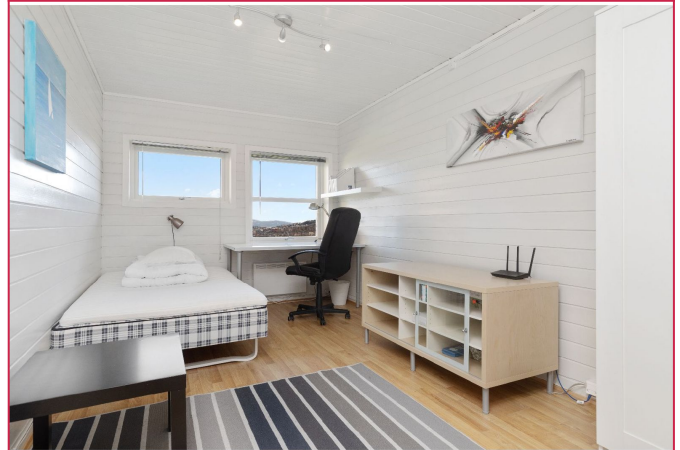
Alle soverom er av god størrelse (Utleid)