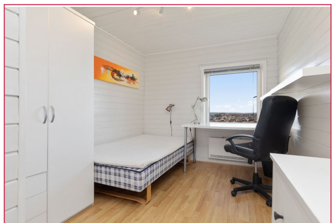
Nye senger i alle rom (Ledig)