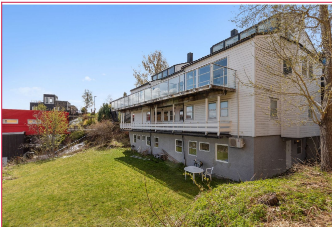
Leiligheten ligger i sokkeleig.