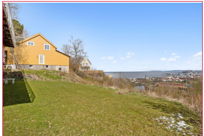
Fantastisk utsikt fra hage og leilighet forøvrig