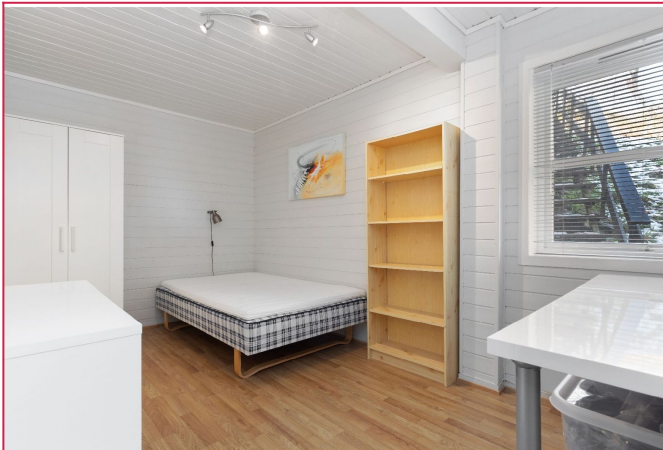
Soverommet er av god størrelse. Ny seng, overmadrass og kontorstol (Utleid)