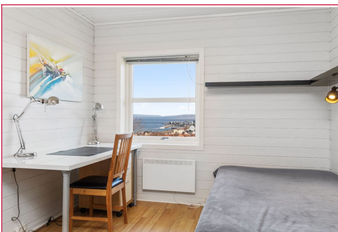
3 av rommene har flott utsikt mot Trondheim sentrum (Utleid)