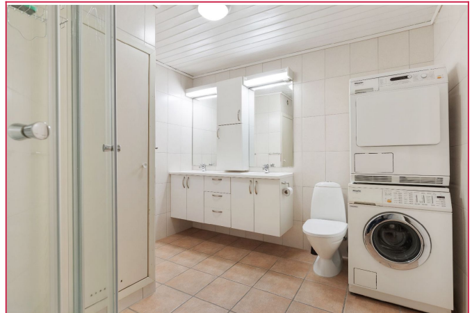
Flislagt bad med vaskemaskin og tørketrommel