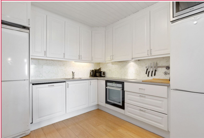
Alt av hvitevarer, godt med skapplass