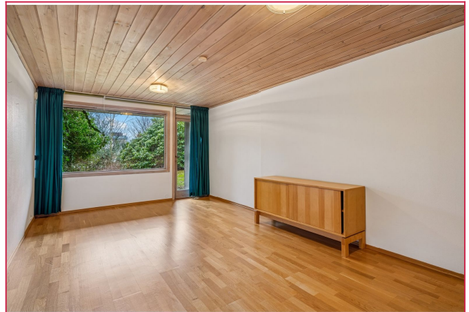
Romslig soverom i underetasje