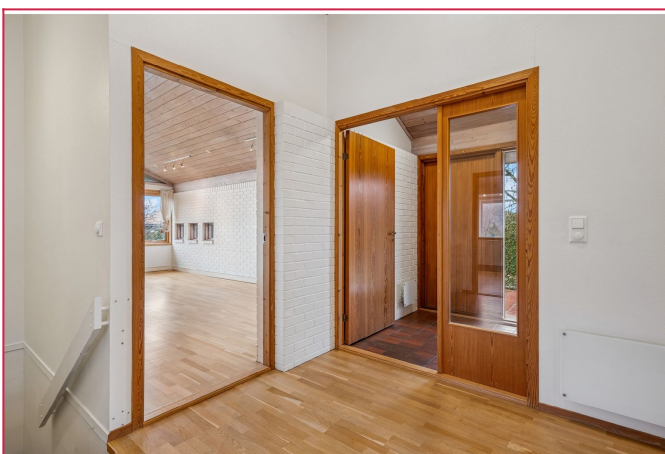
Entre og gang