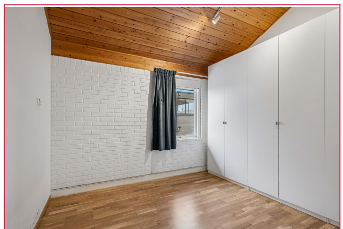
Soverom i hovedetasjen