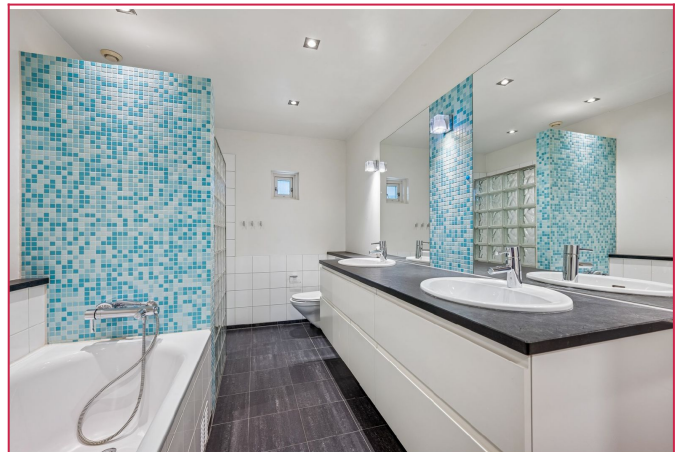
Flislagt bad med dusj og badekar