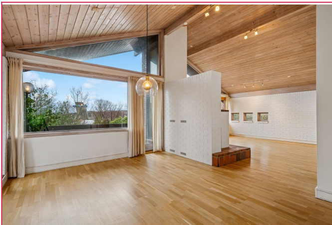
Romslig spise- og stue med utgang til terrasse