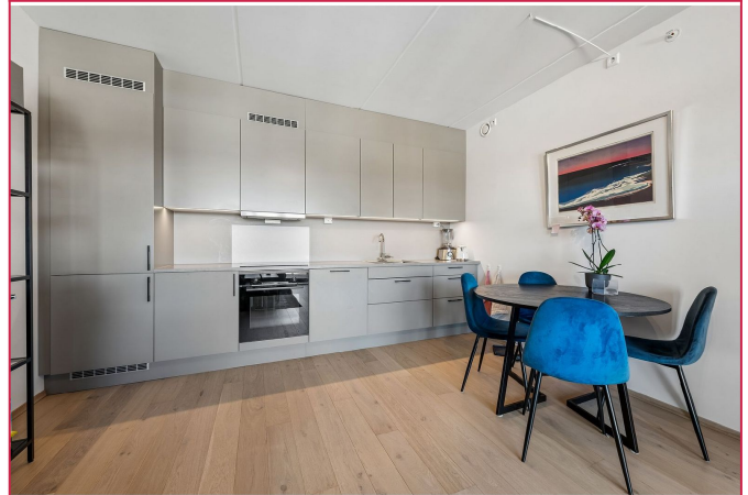
Kjøkken med integrerte hvitevarer