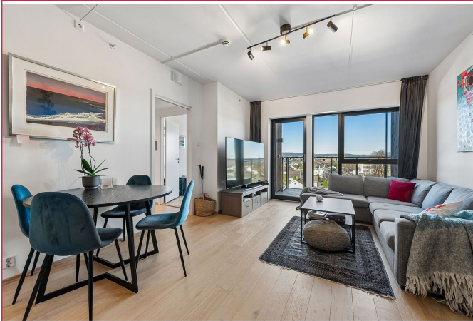
Stue med utgang til balkong