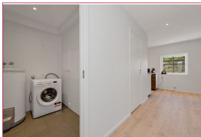
Vaskerom/ teknisk rom