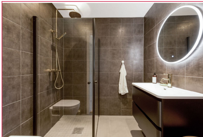
Lekker bad med plassbesparende dører