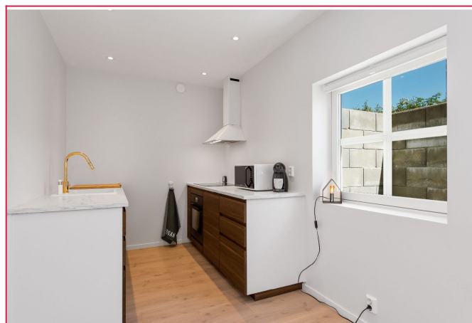
Nytt moderne kjøkken med integrerte hvitevarer