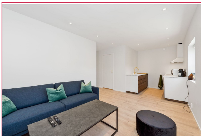
Stue med åpen kjøkkenløsning