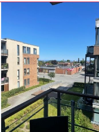
Utsikt fra balkongen