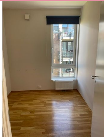
Soverom nr 2