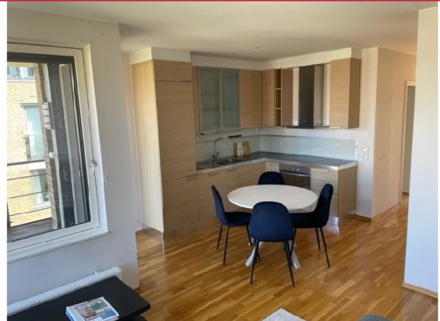
Kjøkken med spisebord