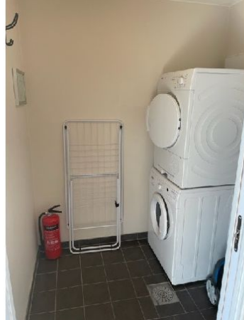
Vaskerom med vaskemaskin og tørketrommel