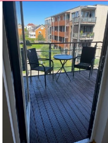
Fra stuen er det utgang til balkong