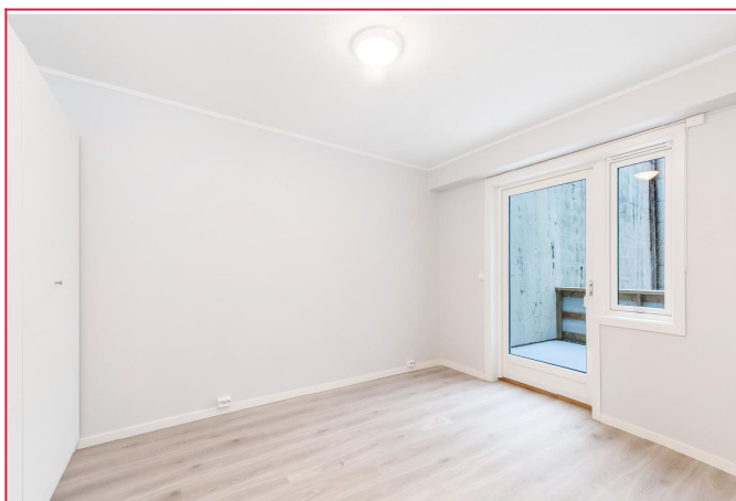
Soverom nr 2 med utgang til balkong