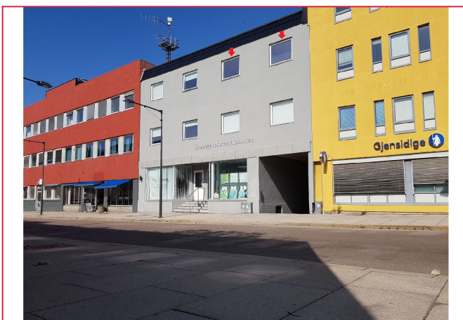
Leiligheten ligger i 3.etg (ikke de røde pilene, men til venstre)