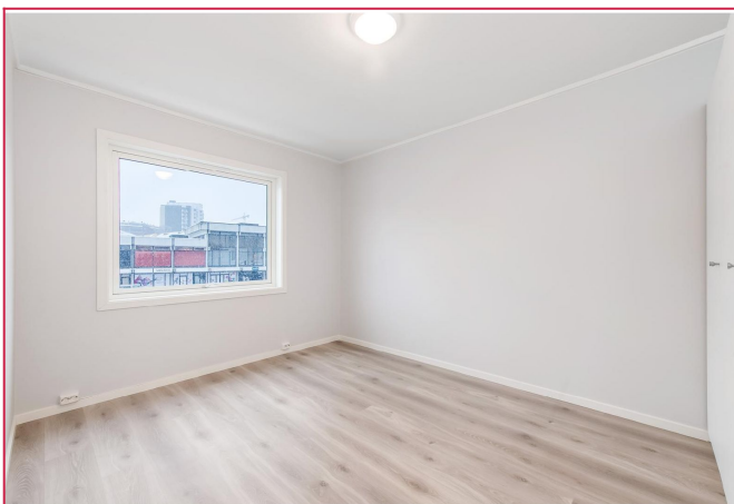
Soverom nr 1 med garderobeskap