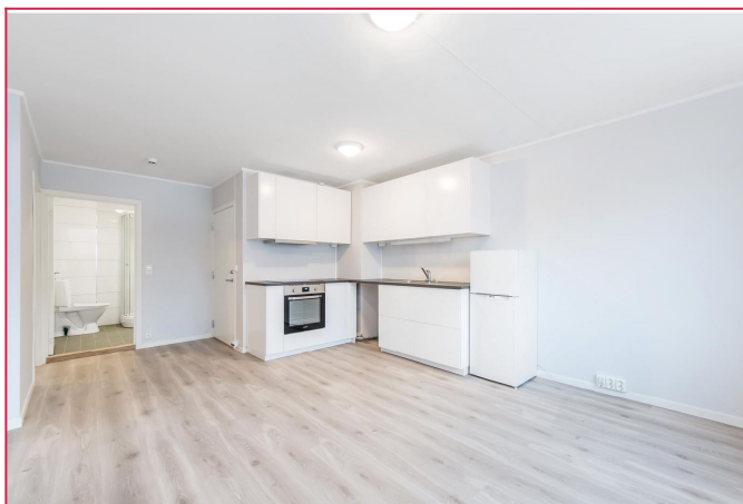
Kjøkken med hvitevarer