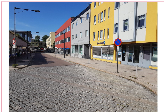
Sentralt med busstasjon og kjøpesenter like ved