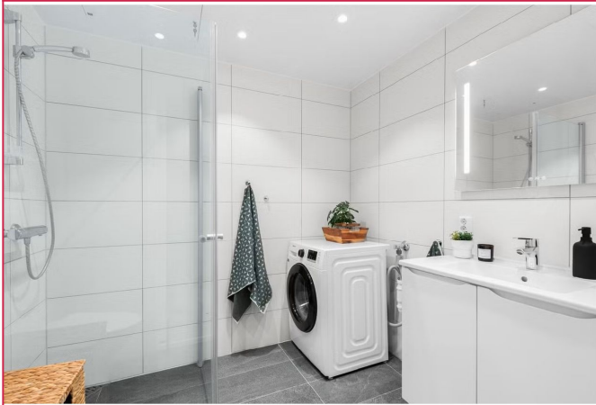
Pent og flislagt bad med innfellbare dusjdører. Det er installert vaskemaskin på badet.