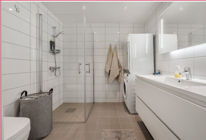
Bad med tørketrommel og vaskemaskin