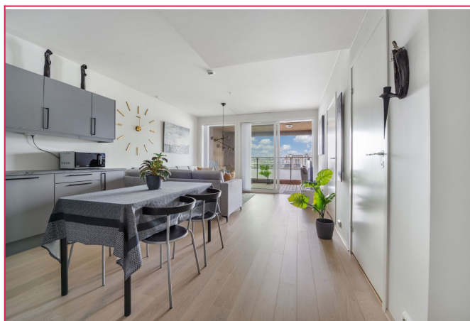
Åpen løsning med flott utsikt