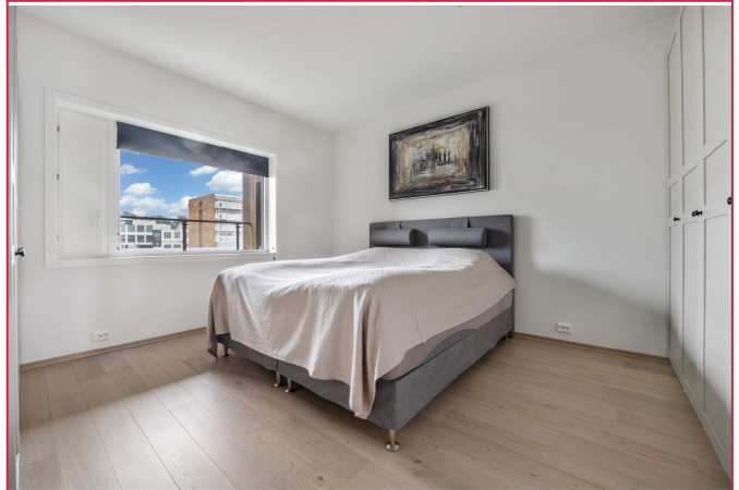
Hovedsoverom med god lagringsplass