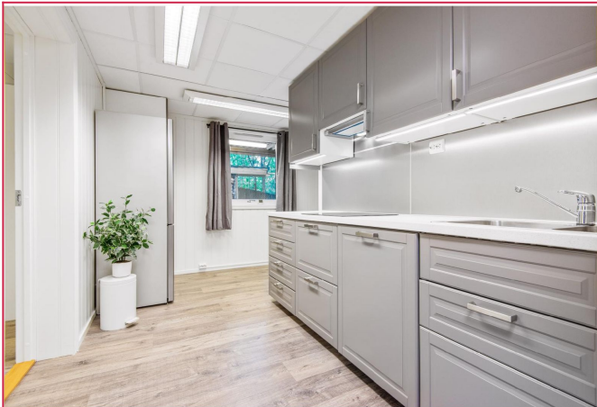
Romslig 2-roms sokkelleilighet som er oppgradert i nyere tid.