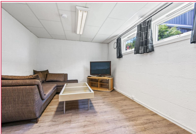
Stue med god plass til sittegruppe.