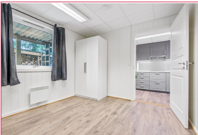
Soverom med plass til stor seng.