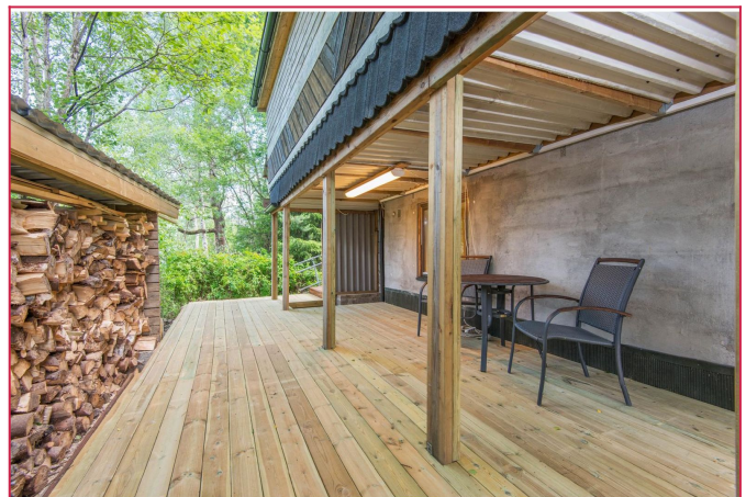
Egen skjemet terrasse like utenfor leiligheten.