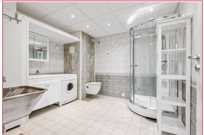
Stort flislagt badrom. Vaskemaskin medfølger.