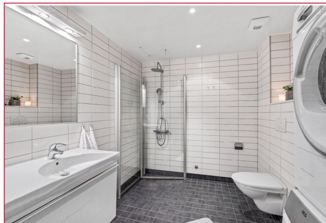
Stort bad med både vaskemaskin og tørketrommel