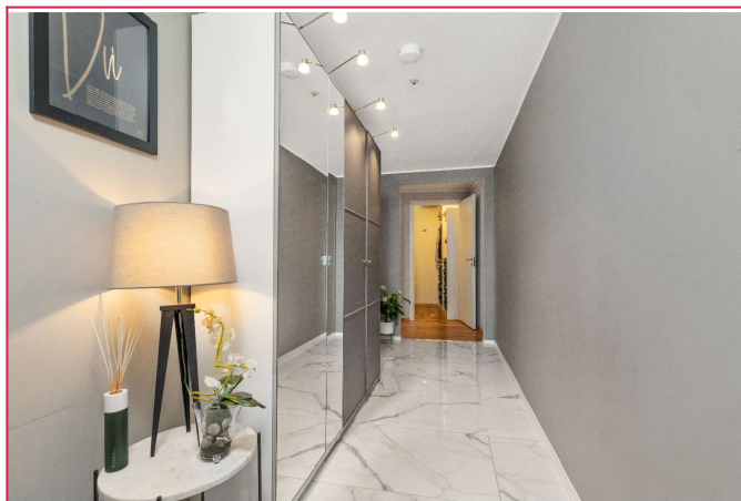
Stor entrè med god skaplass