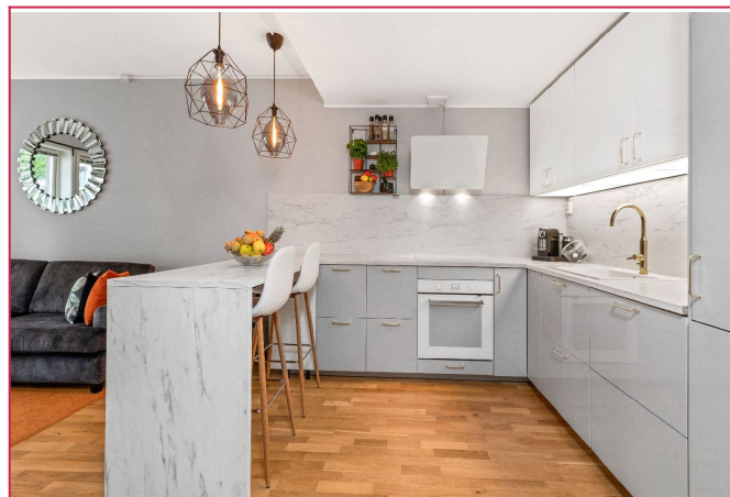
Lekker kjøkken med gjennomførte detaljer