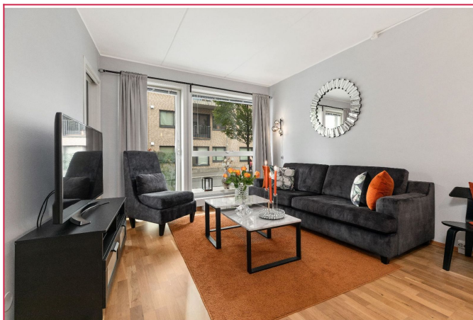
Koselig sofaplass (plissegardiner blir satt inn)