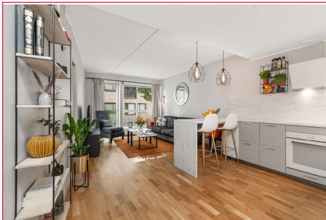
Stor åpen stue-kjøkken løsning med store vinduer som gir rikelig med lys