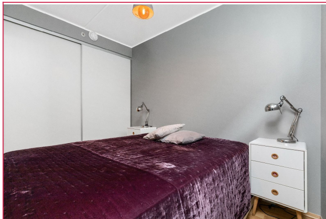
Stort soverom med god skaplass