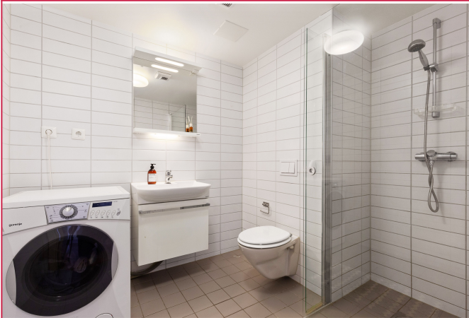
Pent flislagt bad med varmekabler i gulv. Vaskemaskin følger med.