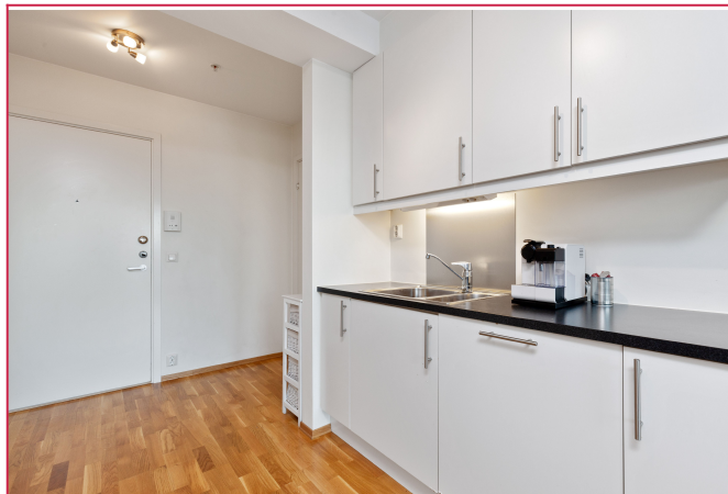
Flott kjøkken med god skaplass og integrerte hvitevarer.