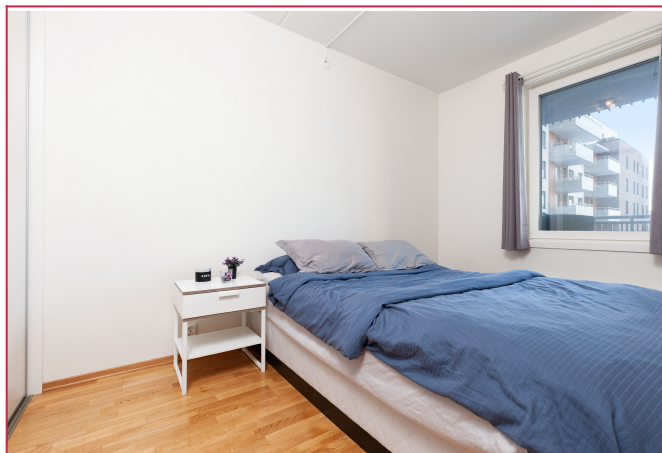
Soverommet har plass for seng av god størrelse. Godt med lagringsplass i skyvedørgarderobe.