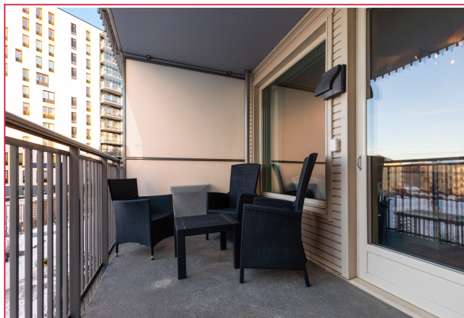
Godt med plass for utemøbler på balkongen.