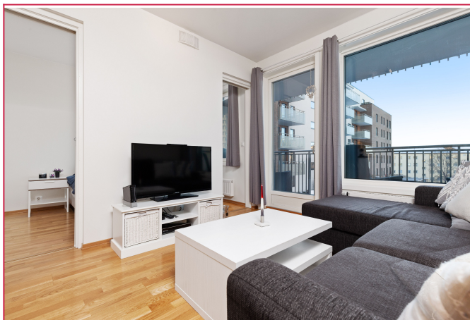
Plass for sofa og tilhørende møblement.