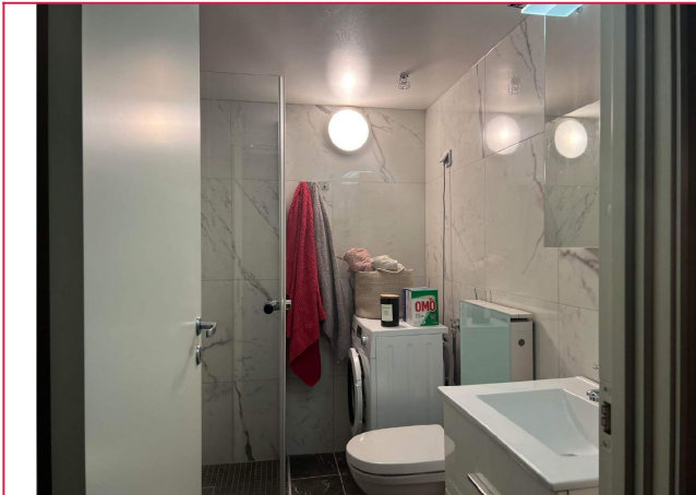
Pent flislagt bad med varmekabler i golv.