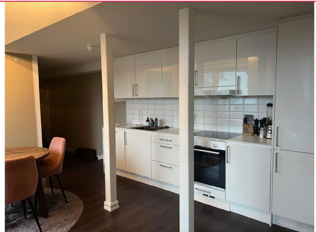
Godt med skap og benkeplass i kjøkken.