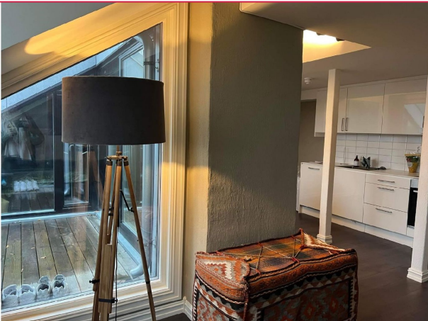
Romslig balkong med god plass til utembøler og grill.