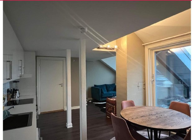
Utgang til balkong fra stue.