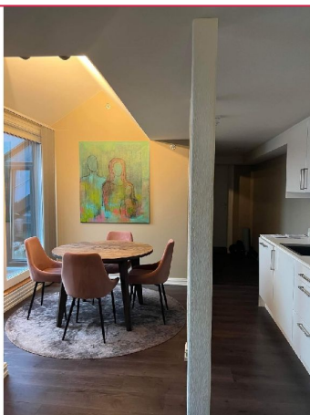
Plass til spisebord i kjøkkendel.