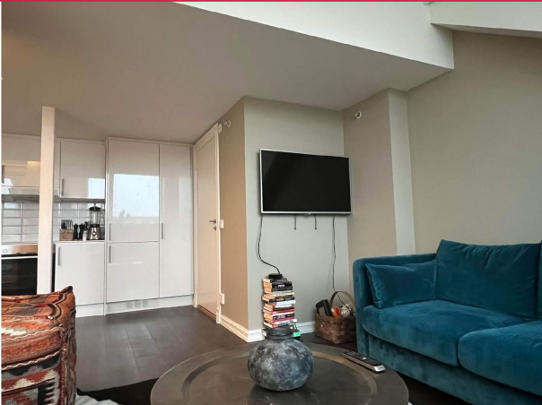
Leiligheten ligger i toppetasjen på bygget.