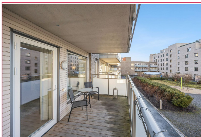
Stor balkong med god plass til utemøblement og grill