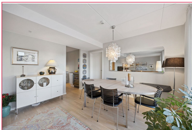
Stuen er innredet med et større spisebord