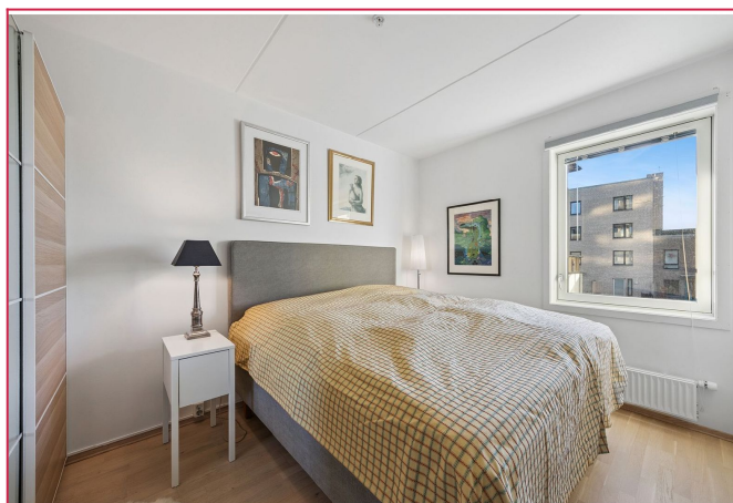
Lyst og romslig soverom med skyvedørgarderobe