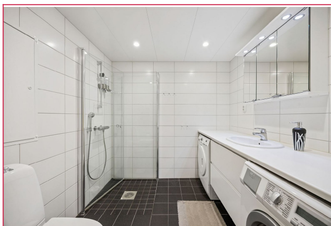
Pent flislagt bad med varmekabler. Vaskemaskin og tørketrommel medfølger