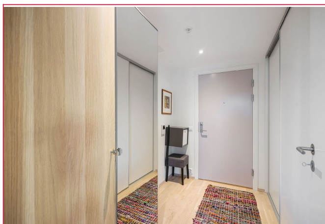
Velkommen inn! Entre med plass til oppheng av klær og sko i skyvedørgarderobe