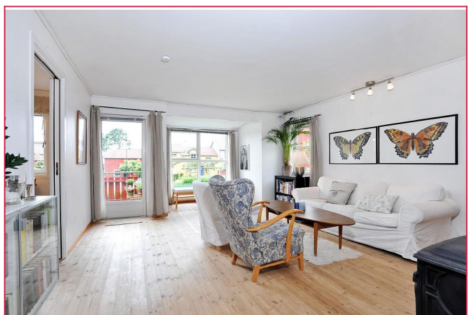
stue (møblene på bildene medfølger ikke)