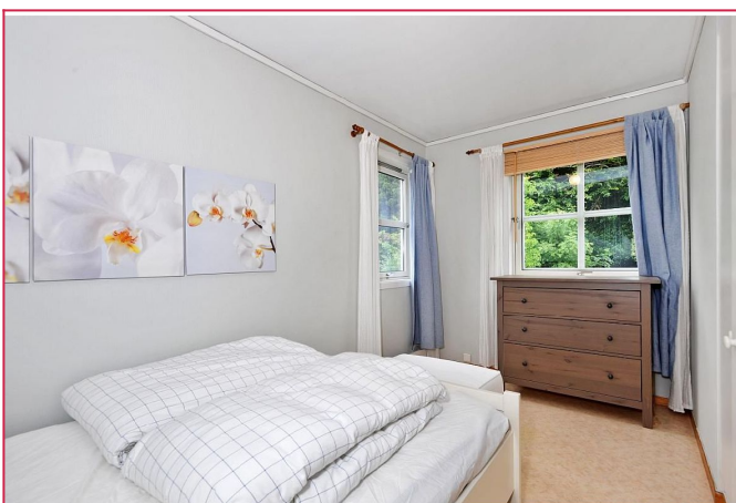
soverom 1 (møblene på bildene medfølger ikke)