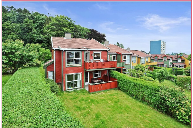
Fasade - boligen er nå lysmalt og ikke lenger rød.