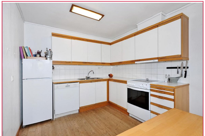
kjøkken (hviteware medfølger)