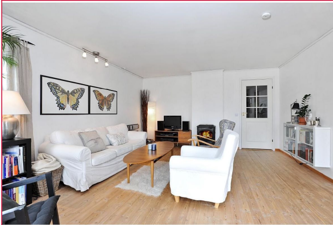
stue (møblene på bildene medfølger ikke)