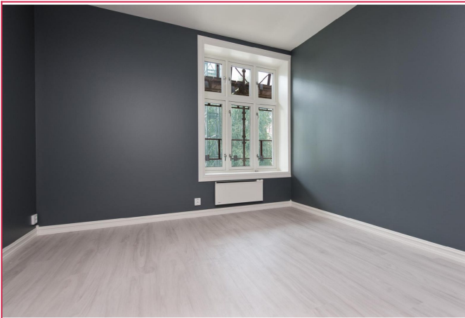
Soverom 1 har god plass til dobbeltseng og pult.