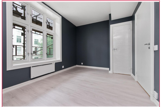
Soverom 2 har plass til dobbeltseng, pult og garderopbeskap.