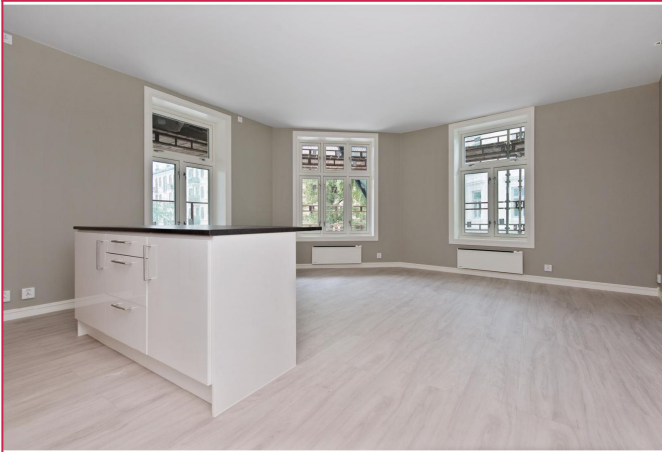
Store vinduer som slipper inn rikelig med naturlig lys.