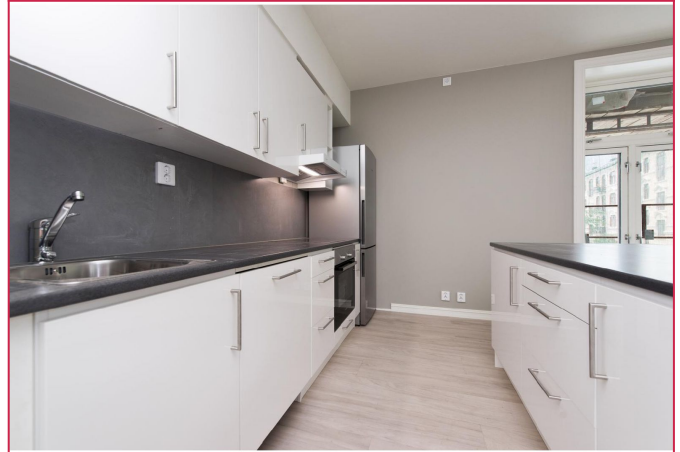
Godt med skap og benkeplass. Hvitevarer på kjøkken følger med.