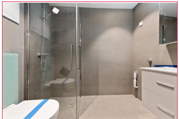
Pent flislagt bad med varmekabler i gulv. Opplegg til vaskemaskin.