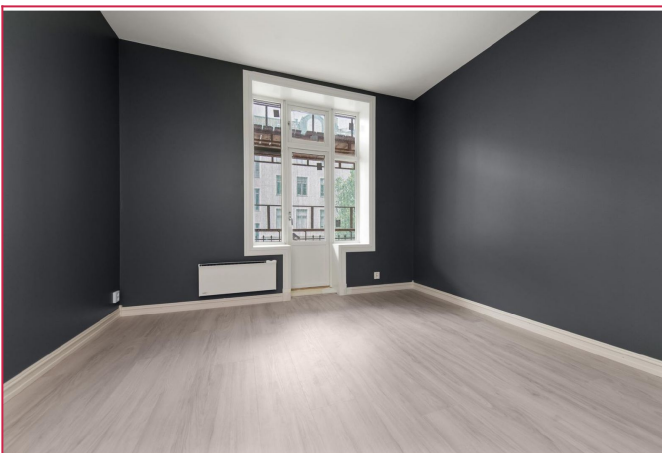
Soverom 3 har plass til dobbeltseng og pult.